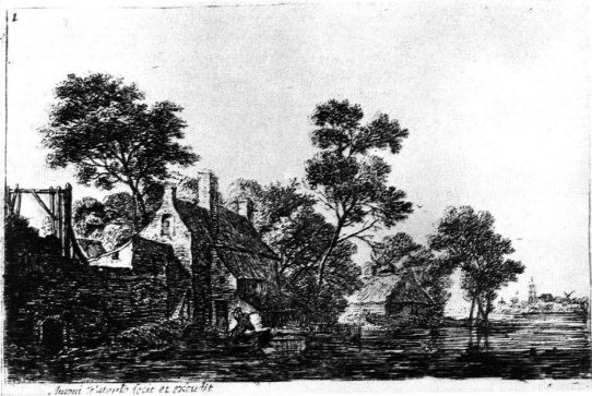
Abb. 1. Radierung von Anthonie Waterloo (1610?—1690) Die Rückkehr des Fischers