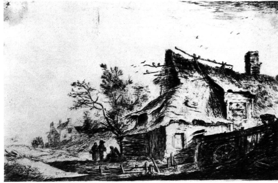
Abb. 3. Radierung von Anthonie Waterloo (1610?—1690) Die Mühle am Wasser