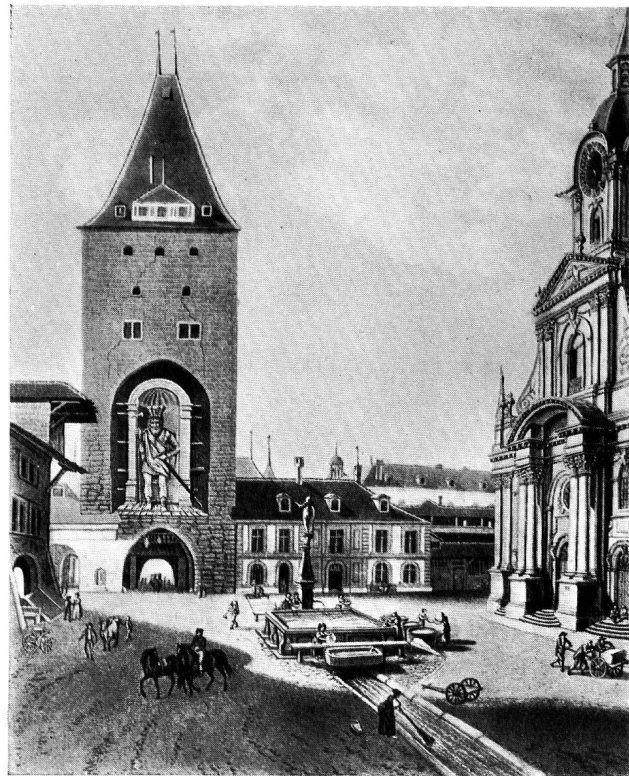
Abb. 6a. ALBRECHT VON NÜRNBERG CHRISTOFFEL AM BERNER OBERTOR Stich von Chr. Meichelt nach Zeichnung Lorys d. Ä., 1818.