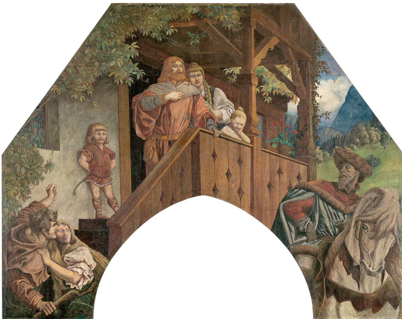
Abb. 2 Die legendenhafte Überlieferung im Weissen Buch von Sarnen zur Auseinandersetzung zwischen Stauffacher und dem Landvogt Gessler vor dem steinernen Wohnhaus Stauffachers im schwyzerischen Dorf Steinen wurde 1891 durch den aus Passau stammenden und vor allem in München tätigen Historienmaler Ferdinand Wagner (1847–1927) künstlerisch umgesetzt.

Die heutige als Schwyz bezeichnete, unmittelbar um die Kirche St. Martin samt Friedhof gruppierte Ortschaft wird – wie bereits erwähnt – in den Quellen seit