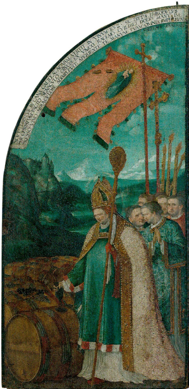
Fig.5 Triptyque de saint Théodule, de Hans Bock l'Ancien (vers 1550–1624), 1596. Huile sur panneaux de bois, 166,5 cm de haut sur 82 cm. Sion, Musée d'histoire du Valais, dépôt du chapitre cathédral de Sion. Volet droit ouvert.

dimension de réalité, le choix de ce miracle insiste sur la dimension de protection des fidèles du diocèse de Sion. En cette fin du XVI e siècle, Théodule, patron du Valais, n'est plus représenté en saint tutélaire se détachant sur un fond d'or, mais bien comme pourvoyeur du bien-être de ses ouailles, partageant leur souci de subsistance économique.