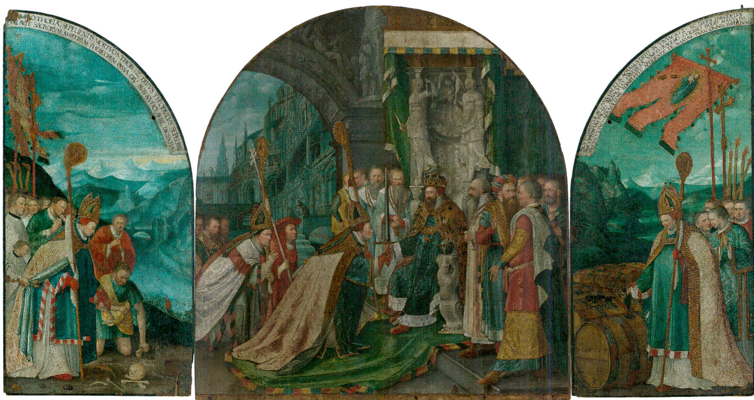
Fig.1 Triptyque de saint Théodule, de Hans Bock l'Ancien (vers 1550–1624), 1596. Huile sur panneaux de bois, 166,5 cm de haut sur 328,5 cm ouvert. Sion, Musée d'histoire du Valais, dépôt du chapitre cathédral de Sion. Vue d'ensemble.

C'est entre le XI e siècle et le XII e siècle, soit entre 1070–1080 et 1165, que la légende de saint Théodule prend une