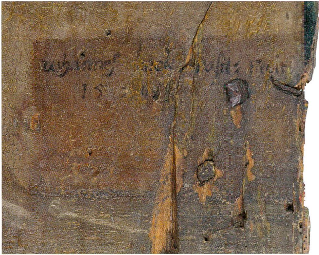
Fig.2 Triptyque de saint Théodule, de Hans Bock l'Ancien (vers 1550–1624), 1596. Sion, Musée d'histoire du Valais, dépôt du chapitre cathédral de Sion. Détail de la signature.

forme écrite sous le titre de Vita beati Theodori episcopi sedunensis , rédigée par le moine pèlerin nommé Ruodpert. Sur le modèle d'une histoire racontée, le style narratif semble indiquer que l'auteur a collecté des récits d'actions traditionnellement attribuées à notre évêque. Si ce texte n'est pas construit sur le modèle classique des hagiographies rapportant des éléments de l'enfance du saint, sa conversion, ses miracles et enfin sa mort en odeur de sainteté, il a le mérite de renseigner sur trois épisodes précis de la vie de Théodule.