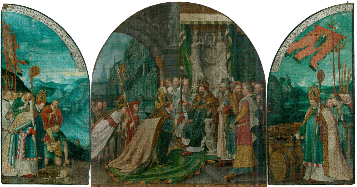
Fig.1 Triptyque de saint Théodule, de Hans Bock l'Ancien (vers 1550–1624), 1596. Huile sur panneaux de bois, 166,5 cm de haut sur 328,5 cm ouvert. Sion, Musée d'histoire du Valais, dépôt du chapitre cathédral de Sion. Vue d'ensemble.

C'est entre le XI e siècle et le XII e siècle, soit entre 1070–1080 et 1165, que la légende de saint Théodule prend une