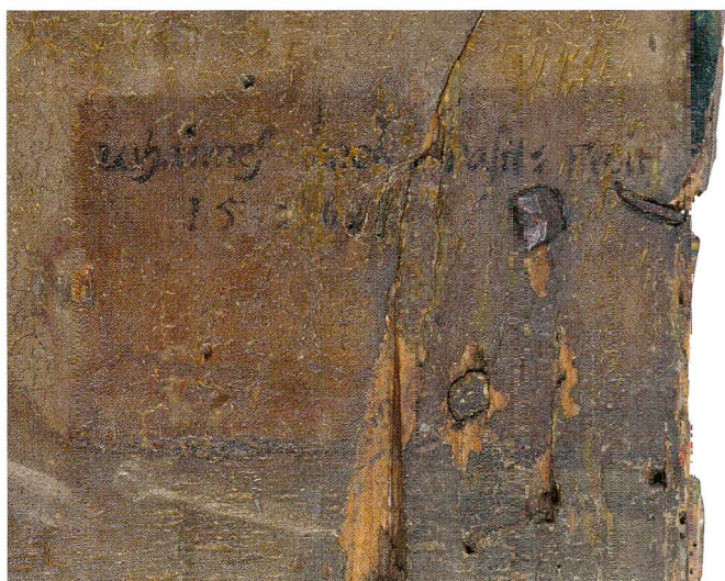
Fig.2 Triptyque de saint Théodule, de Hans Bock l'Ancien (vers 1550–1624), 1596. Sion, Musée d'histoire du Valais, dépôt du chapitre cathédral de Sion. Détail de la signature.

forme écrite sous le titre de Vita beati Theodori episcopi sedunensis , rédigée par le moine pèlerin nommé Ruodpert. Sur le modèle d'une histoire racontée, le style narratif semble indiquer que l'auteur a collecté des récits d'actions traditionnellement attribuées à notre évêque. Si ce texte n'est pas construit sur le modèle classique des hagiographies rapportant des éléments de l'enfance du saint, sa conversion, ses miracles et enfin sa mort en odeur de sainteté, il a le mérite de renseigner sur trois épisodes précis de la vie de Théodule.