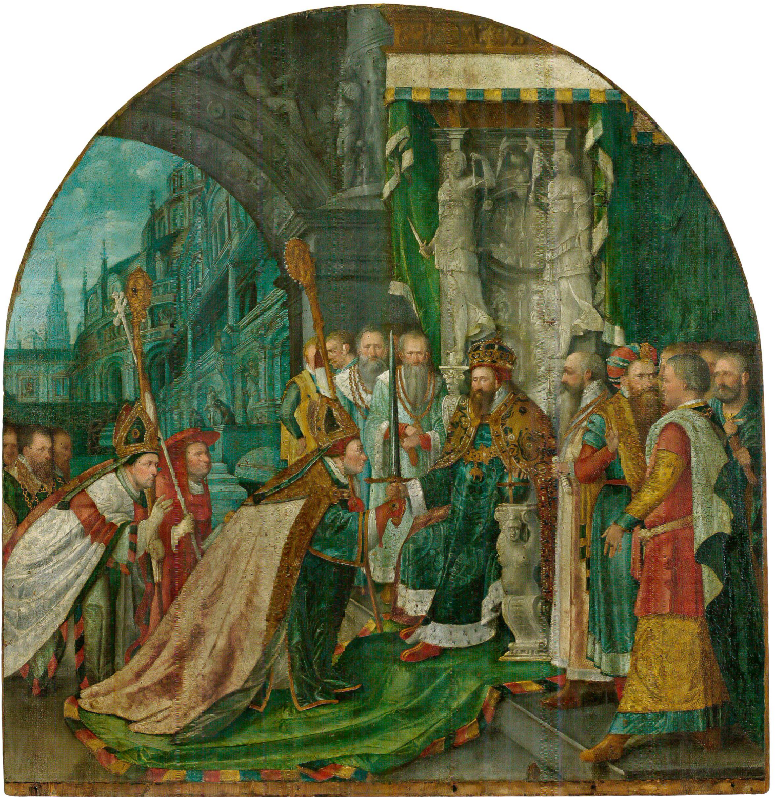
Fig. 6 Triptyque de saint Théodule, de Hans Bock l'Ancien (vers 1550–1624), 1596. Huile sur panneaux de bois, 166,5 cm de haut sur 163,5 cm. Sion, Musée d'histoire du Valais, dépôt du chapitre cathédral de Sion. Panneau central.