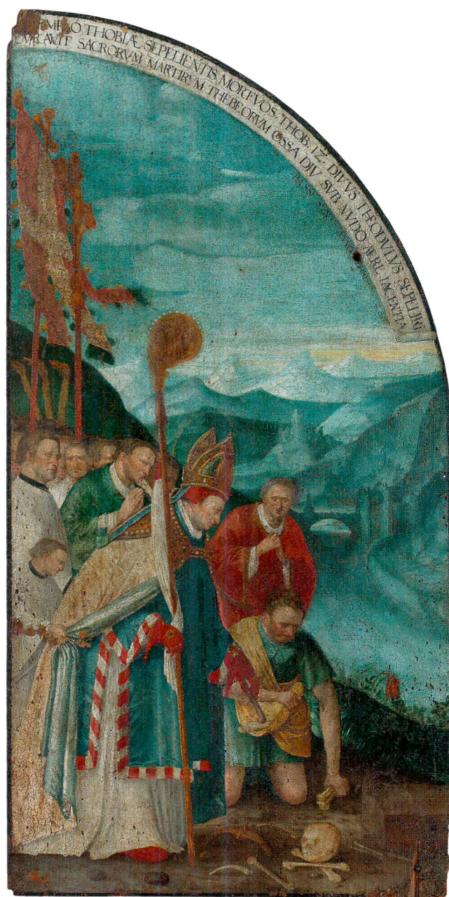
Fig.4 Triptyque de saint Théodule, de Hans Bock l'Ancien (vers 1550–1624), 1596. Huile sur panneaux de bois, 166,5 cm de haut sur 79,5 cm. Sion, Musée d'histoire du Valais, dépôt du chapitre cathédral de Sion. Volet gauche ouvert.

maigre vendange en un moût abondant. L'inscription peinte mélange un verset de l'évangile de Jean, chapitre 2, 1–12, les noces de Cana, avec un extrait de la Vie de Théodule et un psaume. 6 Comme sur le volet précédent, le saint est représenté en véritable acteur de la scène. Il presse de sa propre main nue une grappe dans le premier tonneau d'une longue série. Dans le fond s'élèvent des hautes montagnes enneigées et les collines du premier plan sont sommées de châteaux comme tout au long de la vallée du Rhône. Au-delà de ces détails qui confèrent à la scène une