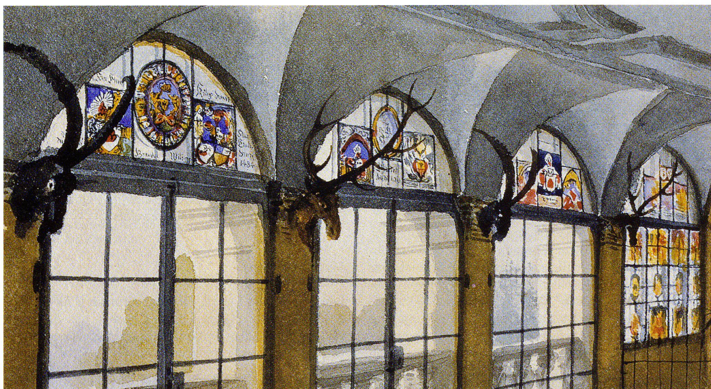
Abb. 2 Detail der Eingangshalle mit Jagdtrophäen und Glasgemälden.