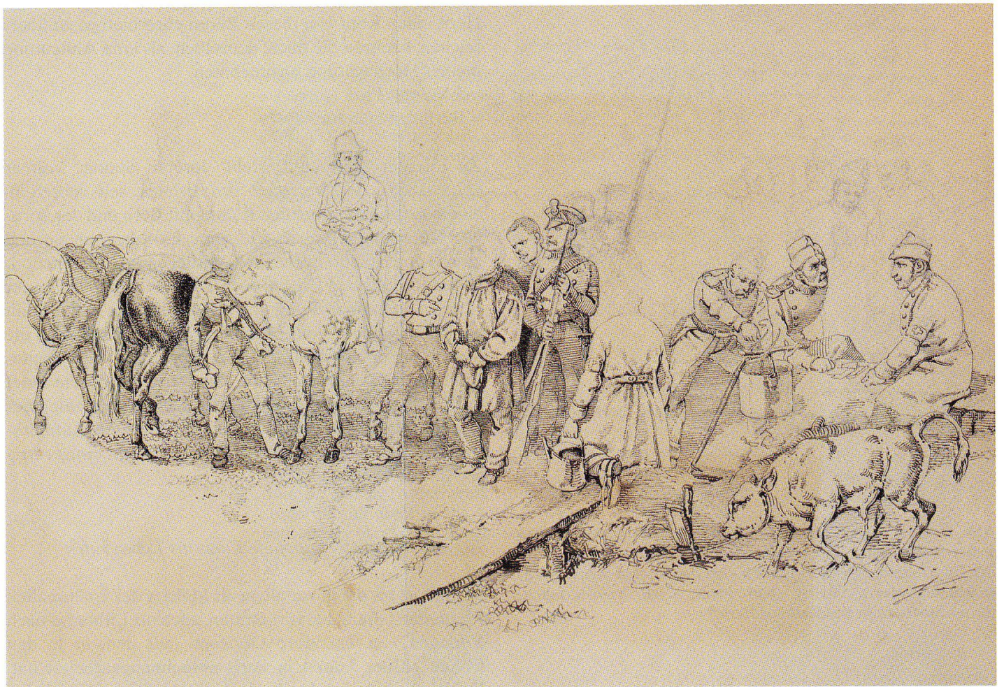
Abb. 2 Verhör eines Landsturmmannes durch Oberst Ulrich Ochsenbein vor dem Aufstieg auf die Bramegg, von Joseph Simon Volmar, 1847. Federzeichnung über Graphitzzeichnung auf Papier, 38×58,7 cm (ohne Rahmen). Schweizerisches Nationalmuseum.

An der militärischen Operation innerhalb dieses Prozesses, das heisst an der gewaltsamen Auflösung des Sonderbundes, den sieben katholische Orte Ende Dezember 1845 untereinander geschlossen haben, ist Joseph Simon Volmar direkt beteiligt, als Trainhauptmann in der von Ochsenbein persönlich kommandierten 7. Division, der sogenannten Berner Reservedivision. Militärisch ist er daran beteiligt, aber nicht nur: dass er sich auch künstlerisch mit dem Sonderbundskrieg auseinandergesetzt hat, belegt jetzt eine unsignierte Volmar-Handzeichnung mit den Blattmassen 38×58,7 cm, die das Schweizerische Nationalmuseum im Herbst 2010 erworben hat (siehe Abb. 2). Auf der Zeichnung findet sich keine Inschrift, doch auf dem Rückenschutz der ehemals gerahmten Zeichnung sind Notizen angebracht: