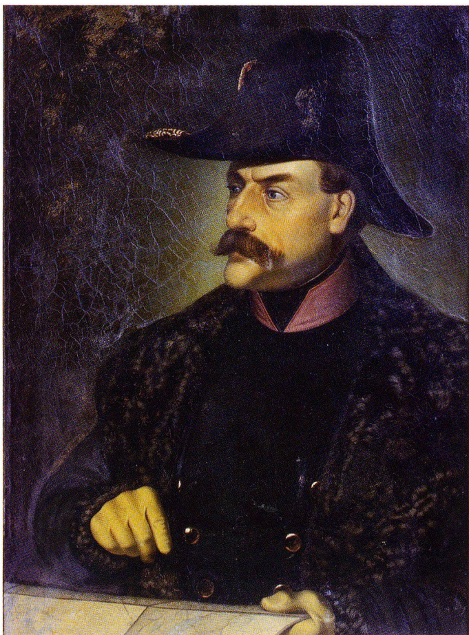
Abb. 3 Ulrich Ochsenbein in Uniform mit charakteristischem individuellem Pelzmantel. Bildnis Ulrich Ochsenbeins, Maler unbekannt, um 1848. Öl auf Leinwand. Bernisches Historisches Museum.