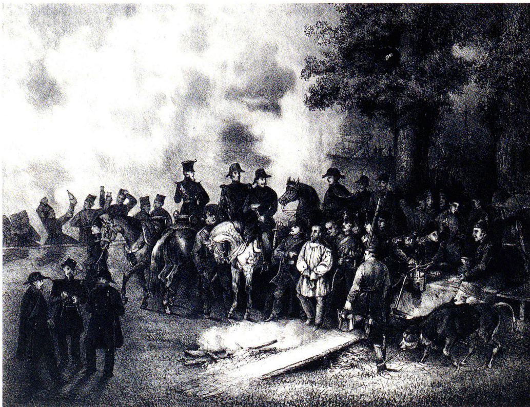
Abb. 4 Unsignierte, unbeschriftete Lithografie mit einer Szene aus dem Sonderbundkrieg. Zentral- und Hochschulbibliothek Luzern.

Bemerkenswert ist das «Neben- und Nachleben» von Volmars Sonderbundsdarstellung. Die Zentral- und Hochschulbibliothek Luzern ist im Besitz einer unsignierten, undatierten und überhaupt vollständig unbeschrifteten Lithografie (Abb. 4), von der auch nicht bekannt ist, unter welchen Umständen, zu welchem Zeitpunkt und durch wen sie in die Bibliothek gekommen ist, die aber in einem offensichtlichen Zusammenhang mit Volmars Handzeichnung steht. 17 Im Zentrum des Bildes ist dieselbe, wenn-