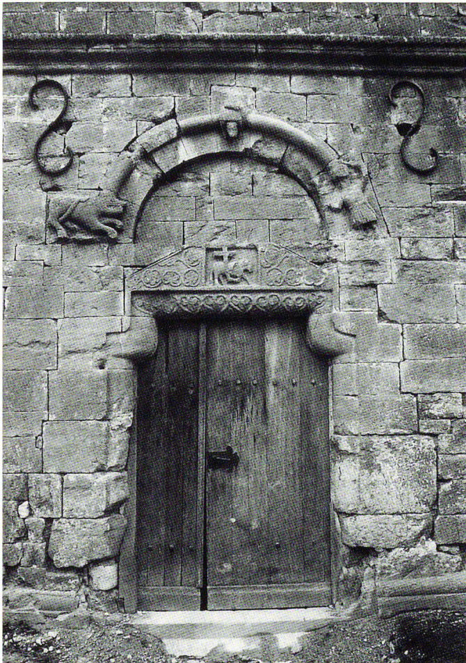
Abb. 4 Tympanon des Westportals mit Ornament und Figuren.

Dieses Schauspiel ist, hier sind sich die Interpreten der Fassadensymbolik fast ausnahmslos einig, 9 als der ewige Kampf zwischen zwei grossen Mächten dieser Welt, zwischen Gut und Böse, zu deuten. Das Böse wird durch