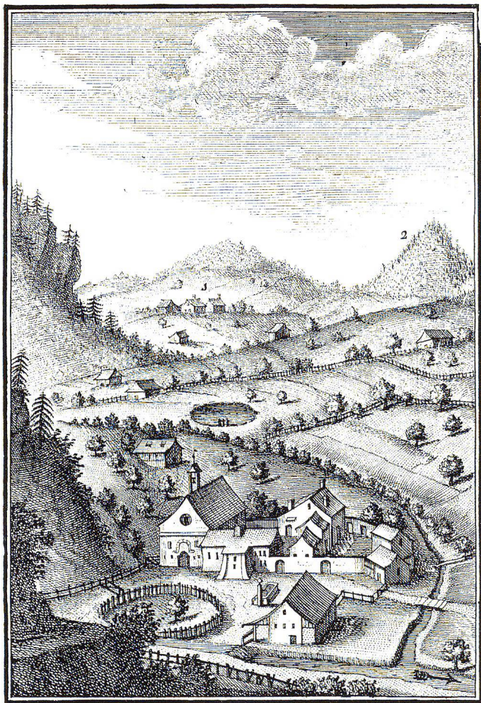
1. Kirchzimer. 2. Dürreck.