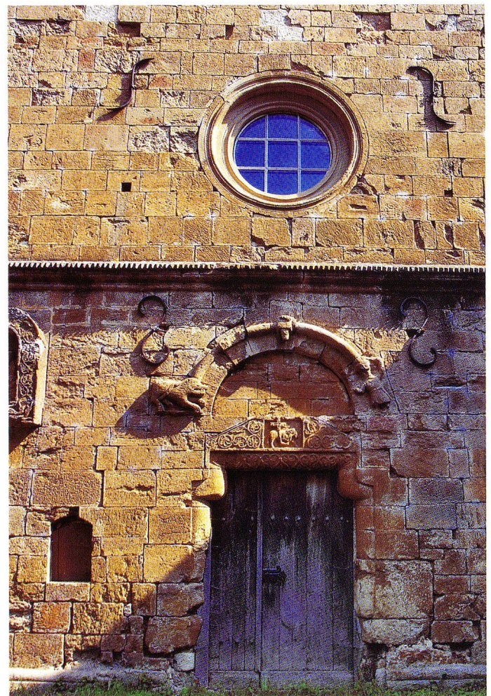
Abb. 3 Klosterkirche, Westportal mit Figuren und Ornament im Tympanon.

das Kloster rund 340 Jahre nach der Weihung, nach einigen Jahrhunderten mönchisch-religiösen Lebens in seinen Mauern, von einheimischen Bauern geplündert, verwüstet 6 und dann im Jahre 1529 – als Folge der Basler Reformation – aufgehoben worden ist. In der Folgezeit, so berichten die Annalen, wurde das Kloster als Sennhof ver-