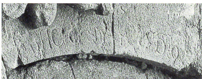
Abb. 6 Löwe am linken Bogenansatz mit schwach erkennbarer Inschrift: HIC EST RODO(S).

dualisiert wiedergegeben und tragen schon deshalb keine Eigennamen.