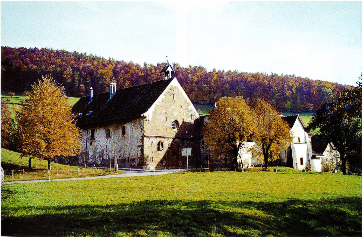
Abb. 1 Schönthal in Langenbruck.

An der alten, heute wenig befahrenen Passstrasse von Langenbruck nach Eptingen tritt uns in einem lieblich gelegenen Seitental, am Südhang des Hauensteins, das Kloster Schönthal entgegen (Abb. 1 und 2). Die Westfront der Klosterkirche, «ein Prunkstück romanischer Architektur» 2 , ist die älteste erhaltene Gebäudefassade des Kan-