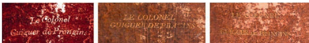
Fig. 4 Les supralibros de Charles-Jules Guiguer de Prangins.

Les enfants de Louis-François continueront à apposer leurs supralibros. On connaît ainsi trois manuels militaires ayant appartenu à Charles-Jules Guiguer (fig. 4), quatrième et dernier baron de Prangins (1780–1840), «Le colonel Guiguer de Prangins»: 7