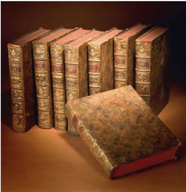
Fig. 1 Une œuvre de la bibliothèque Guiguer de Prangins – [Samuel] PUF[F]ENDORF, Introduction à l'histoire de l'Univers , Paris, Merigot, 1753–1759, 8 tomes, in-4°, illustrée par Eisen.

L'histoire de la bibliothèque du château de Prangins débute en décembre 1754 lorsque Voltaire se plaint du manque de livres. 1 Elle se déroule surtout entre 1771 et 1786 avec les lectures richement commentées dans le Journal de Louis-François Guiguer de Prangins 2 et s'arrête brusquement avec l'inventaire des biens de Louis-François, établi en février 1787. 3