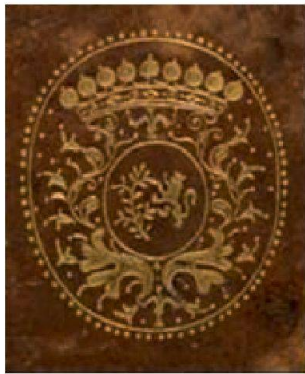
Fig. 3 Recueil d'airs à boire et d'airs tendres . Manuscrit aux armes de Guiguer.

Il y avait d'autres supralibros dans la bibliothèque du château. Notamment un recueil de musique manuscrit aux armes de Guiguer, ayant appartenu à Matilda Guiguer de Prangins, 6 figurant aujourd'hui dans une collection privée (fig. 3).