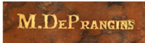
Fig. 2 Le supralibros de la bibliothèque de Jean-Georges et Louis-François Guiguer de Prangins.