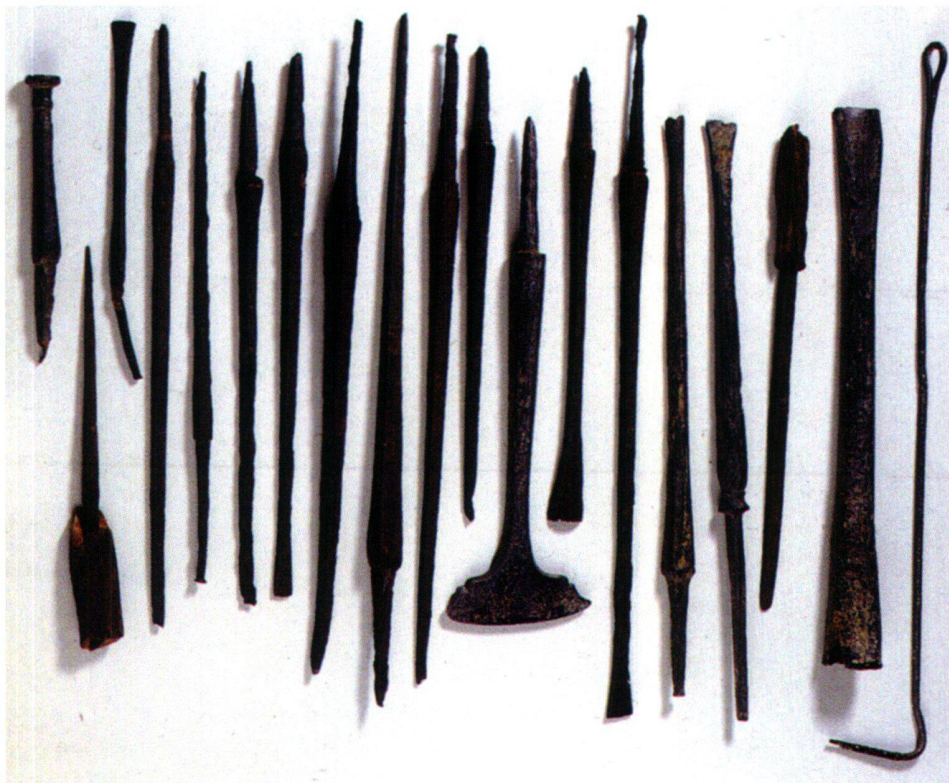
Abb. 1 Werkzeugset eines Sattlers, in einem Lederbeutel im Heiligtum von La Tène deponiert (wohl 3. Jh. v. Chr.). Genf, Musée d'art et d'histoire.

In der Tradition kunstgeschichtlicher Betrachtungsweisen wird die Entwicklung des keltischen Handwerks oft an der technischen und ästhetischen Qualität der hergestellten Produkte gemessen, wobei der Begriff der «Spezialisierung» als eine Art lineare Entwicklungsachse dient.