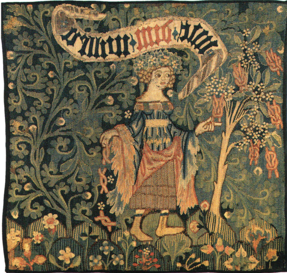
Abb. 1 «Die gelösten Liebesknoten». Gewirkte Kissenplatte, Basel (?) um 1440/1450, ca. 54 cm × 58 cm. Zürich, Schweizerisches Landesmuseum, LM 1077.

Im Schweizerischen Landesmuseum Zürich wird die gewirkte Vorderseite eines Kissenbezugs aufbewahrt, deren Entstehung auf 1440/50 datiert wird (Abb. 1). In einem Erklärungsversuch der dargestellten Szene schreiben Anna Rapp Buri und Monika Stucky-Schürer dazu: «Die überreich herausgeputzte Frau steht neben einem blühenden Holunderbaum, an dem rote Liebesknoten hängen. Indem sie diese mit spielerischer Geste mit der Linken