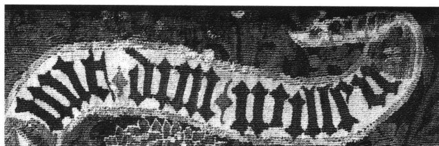
Abb. 4 „mit dim wille n“. Das Spruchband nach Seitenverkehrung. Ausschnitt aus der gewirkten Kissenplatte.

Schluss-N hinter Vokalen meist nicht gesprochen wird, kann der Buchstabe N nämlich als Andeutung eines ungenannten Namens verstanden werden ( mit dim wille, n ). Nebenbei gesagt, entspricht das sogar dem Gebot Non usurpabis nomen Domini Dei tui frustra («Du sollst den Namen des Herrn, deines Gottes, nicht grundlos erwähnen») 8 . Dass die Abtrennung des N tatsächlich bewusst eingeführt worden ist, zeigt sich deutlicher in der seitenverkehrten Wiedergabe (Abb. 4), die ja dem Aussehen der Wirkvorlage, dem sogenannten Bildner entspricht.