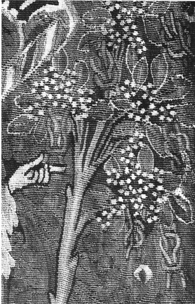
Abb. 2 Die simulierten Liebesknoten im Apfelbaum. Ausschnitt aus der gewirkten Kissenplatte.

Im Allgemeinen ist der fruchtetragende Feigenbaum aber als positives Symbol verstanden worden. Wenn die junge Frau sich umdrehen und sich vom Bösen abwenden würde ( revertere! ), könnte sie seine süssen Früchte erkennen und ernten.