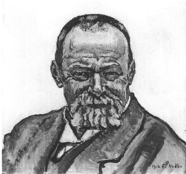
Ferdinand Hodler (Bern 1853–1918 Genf) Selbstbildnis . 1916 Öl auf Leinwand. 39 × 40,5 cm. Aargauer Kunsthaus Aarau

Hodler ist aktuell. Zahlreiche Ausstellungen im In- und Ausland sowie Höchstpreise auf Auktionen haben in jüngster Zeit den Blick der Fachwelt und des kunstinteressierten Publikums auf diesen wichtigen Pionier der Schweizer Moderne gelenkt. So wird die Realisierung eines bislang fehlenden wissenschaftlichen Werkkatalogs der Gemälde Hodlers umso dringender und sinnvoller. Das Schweizerische Institut für Kunstwissenschaft, ein von staatlicher und privater Seite unterstütztes Forschungsinstitut, erarbeitet gegenwärtig gemeinsam mit namhaften Spezialisten den Œuvrekatalog der Gemälde Hodlers und bittet deshalb alle Besitzerinnen und Besitzer von Werken dieses Künstlers um Kontaktaufnahme: Schweizerisches Institut für Kunstwissenschaft, Paul Müller, Zollikerstrasse 32, 8032 Zürich, Tel. (01) 388 51 51, Fax (01) 381 52 50 oder Institut suisse pour l'étude de l'art, Antenne Romande, Université de Lausanne, BFSH 2, 1015 Lausanne, Tel. (021) 692 30 96, Fax (021) 692 30 95, e-mail hodler@sikart.ch . Ebenso von grossem Interesse sind in diesem Zusammenhang Fotografien, Briefe und Dokumente aller Art. Diskretion ist für uns selbstverständlich.