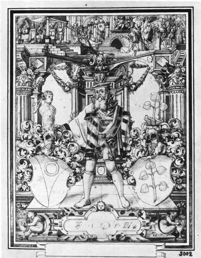
Abb. 3 Scheibenriss mit dem Allianzwappen von Waldkirch-Ifflinger von Granegg. Hieronymus Vischer nach Tobias Stimmer, 1589. Zürich, Schweizerisches Landesmuseum.

Zürich, Schweizerisches Landesmuseum, Inv. LM 5677.