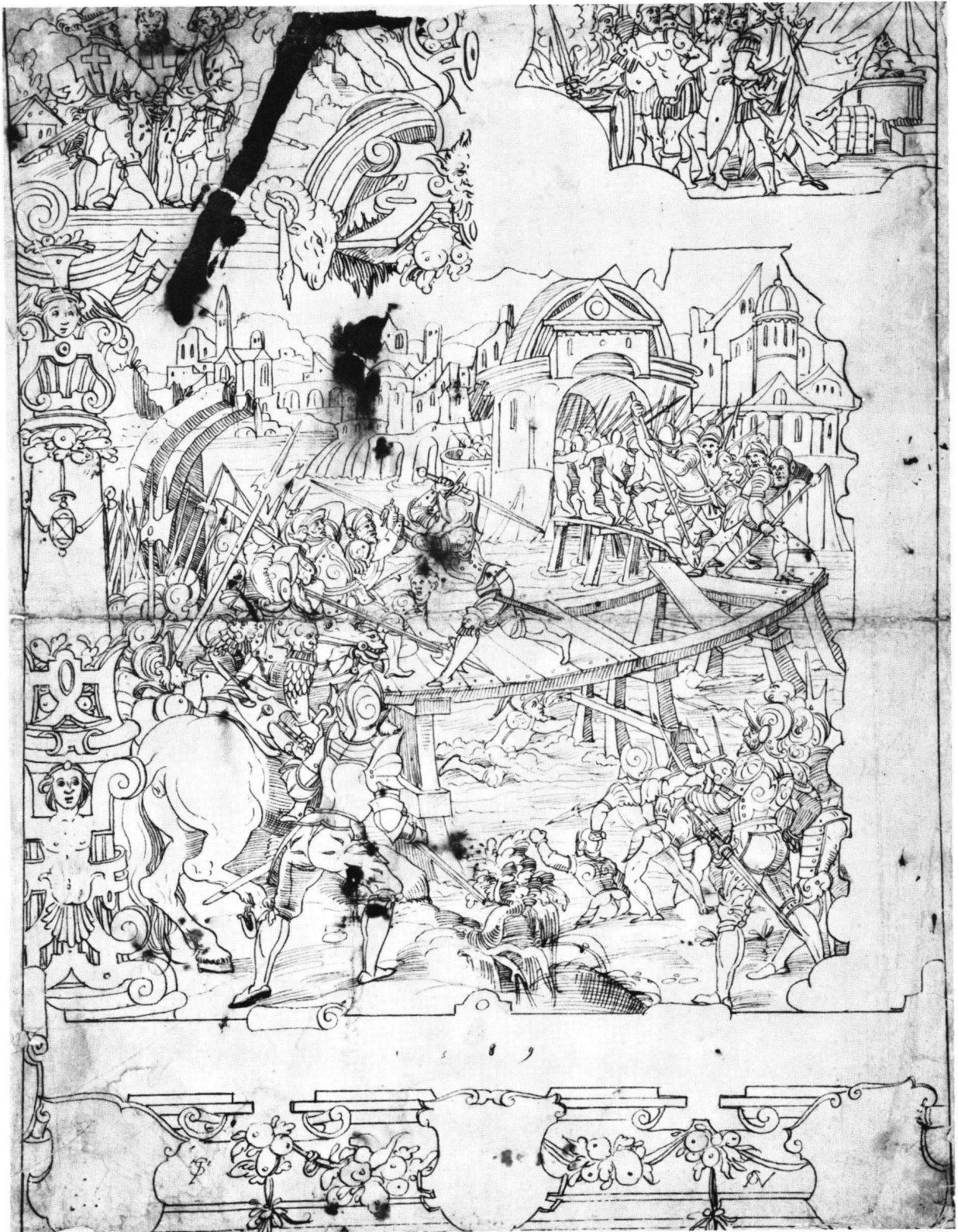
Abb. 5 Scheibenriss mit Horatius Cocles, der die Tiberbrücke verteidigt. Hieronymus Vischer nach Tobias Stimmer, 1589. Federzeichnung. München, Staatliche Graphische Sammlung.