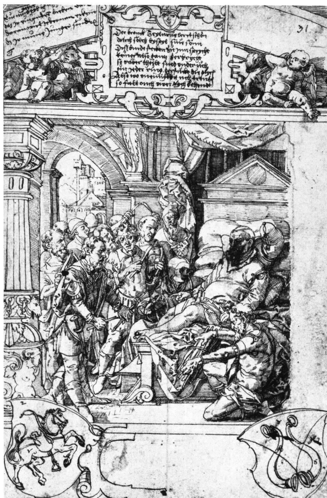
Abb. 2 Scheibenriss mit der Aesop-Fabel vom Vater, der seine Söhne zur Eintracht ermahnt. Tobias Stimmer, 1562? Federzeichnung. Berlin, Staatliche Kunstbibliothek.

Dieselbe Szene, 14 Jahre später und nun ganz anders aufgefasst und von gewaltiger Dynamik erfüllt, findet sich in der Bilderbibel. Der mächtige, ganz in den Vordergrund gerückte, in lodernde Flammen gehüllte Stier auf dem Altar und der ebenfalls durch Grösse und starke Bewegtheit gekennzeichnete Elias dominieren