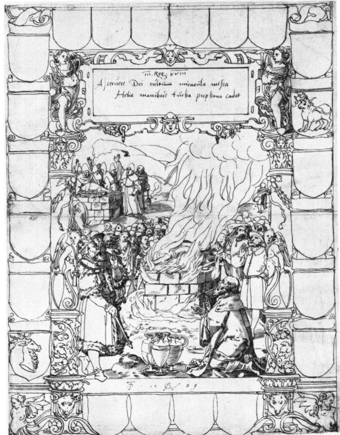
Abb. 1 Scheibenriss mit dem Baalsopfer. Hieronymus Vischer nach Tobias Stimmer, 1589. Federzeichnung. London, Victoria and Albert Museum.

London, Victoria and Albert Museum, Inv. E.523-1911.