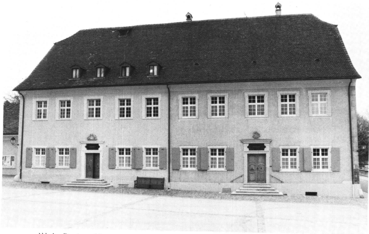
Abb. 1: Domherrenhäuser von Arlesheim, Domplatz 10/12, erbaut 1682/83 nach Plänen von Jakob Engel.