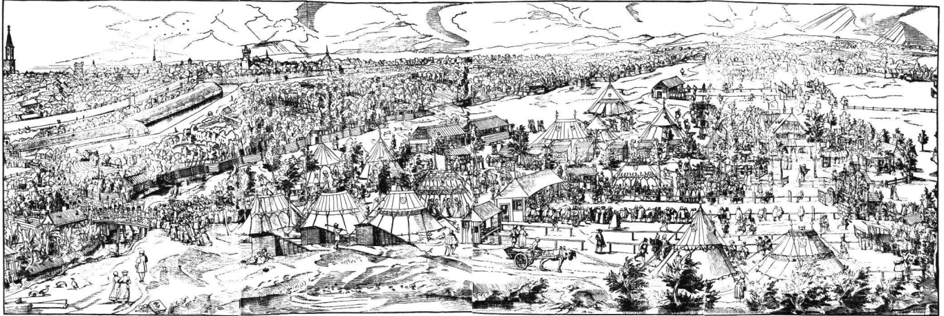
Abb. 2 Holzschnitt mit der Darstellung des Schützenfests von Straßburg 1576. Nach dem Faksimile von August Schrickler, 1880. Zentralbibliothek Zürich, Graphische Sammlung

eine vollständige Darstellung der Schießanlage von der Schießbude der Armbrustschützen im vorderen Mittelgrund links bis zu den Zielscheiben der Büchenschützen im hinteren Mittelgrund rechts angekommen 3 , er habe dann aber mit der Verschiebung des Ausschnitts nach links die Stadt und das zwischen ihr und dem Schieß- und Festplatz pulsierende menschliche Leben ins Bild bringen wollen. Die inhaltlich unergiebigere rechte Partie des Entwurfs wäre so einer erzählerisch wesentlich reicheren und den Schauplatz eindeutig bestimmenden Ausweitung der linken Bildflanke gewichen.