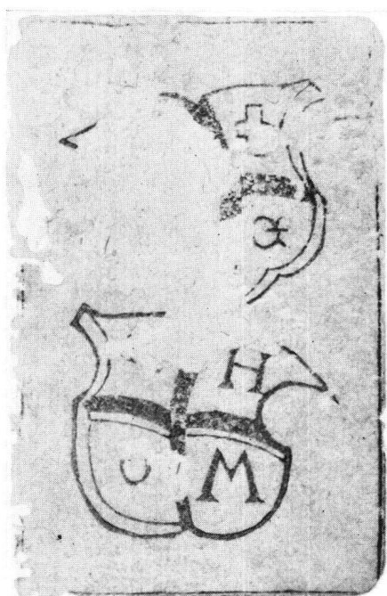
Abb. 1 Schilten-Daus mit Schweizer Kreuz aus dem Spiel im Historischen Museum Basel

1501/1515 (S. 140) auf Grund der ersten Begeisterung für den Basler Eintritt in den Schweizerbund. Die Beigabe von Landeswappen wie die des Schweizer Wappens auf der Schild-Zwei ist bei Spielkarten ganz geläufig und geschah zur Absatzförderung: der Basler Kartenmacher wollte sein Spiel ja nicht nur in Basel absetzen, sondern im ganzen Schweizer Gebiet! Um seine Datierung dieses Spieles (1501/1515) gegenüber den meinigen auf 1560 aufrechterhalten zu können, beschuldigt mich Kopp (S. 1, Anm. 80) der bewußten Verfälschung eines G in ein X, der letzten Ziffer von MDLX. Leider versäumte er, dieses angebliche G in einem zeitgenössischen Alphabet nachzuweisen: J. Kirchner: Die gotischen Schriftarten (1970), hat nichts Derartiges! Selbst ein Kind sieht, daß dieses angebliche G nicht zu den Antiquabuchstaben des unteren Schildes paßt, und was sollte auch ein Buchstabe im oberen Schild, nachdem der untere Schild die Initialen