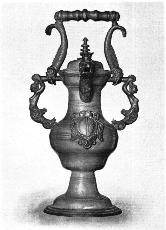
Abb. 2 Ratskanne von 1678. H. 56 cm (Historisches Museum Luzern)

Selbiges aber aufzuobehalten ist ein neüwes gänterli gemacht und mit 2 schlossen versehen worden, damit nit nur der grosweybel ein, sonderen auch h. stattschriber ein schlüssel darzuo habe. Es soll aber dis geschir anderst nit als von mgh. auf dem rahthaus von standts wegen beisamen sein oder tractieren lassen, gebraucht werden, dan das man es ab dem rahthaus oder zuo privat gastreyen darleychen solle, wollen mgh. gar nit haben, sondern haben das selbige völligem raht den 12.tag jenner anno 1685 abkehnt, und hiemit denen die hend gebunden, welche darzuo die schlüssel haben. Man solle dises geschir auch nit mit lauggen, vill weniger mit khatzen-schwäntzen [Schachtelhalme] oder raucher [rauer] materi butzen, sonder deswegen die manier brauchen, als das englische zihn im glantz und ohnversehrt zuo behalten anjetzo in dem brauch ist. Wan man es weschet, sollendt allzeit etwan 5 oder 6 stuck aufeinandern sein, damit die port [Ränder] nicht eingetruckt werden. Ist auch von obigem dato von mgh. erkent, das übrige zinne geschir, so mgh. gehört, namblich 12 mitlere, 12 kleinere, 12 noch kleinere blatten, 12 täller, 3 tischblat, welches alles 88 lb ohngefahr wiget, item 18 2-mässig [= 3,46 Liter]