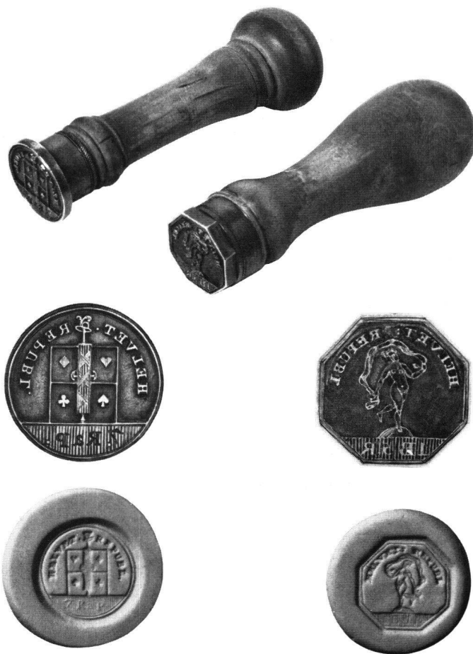
Abb. 2 Handstempel für Spielkartensteuer der Periode April 1801 bis März 1803. Die linke Reihe zeigt den Stempel für gewöhnliche Karten (Landesmuseum Inv.-Nr. 29644), die rechte diejenigen für Tarocke (Landesmuseum Inv.-Nr. 29645), und zwar jeweils von oben nach unten: Gesamtansicht, untere Seite und Abdruck

Auf Euer Cirkular Schreiben vom 22st Courentis, senden Ihnen Angelegen, das Format der größe, nach welcher die Kupferblatte für unser Carten Stempel kan eingerichtet werden. Diese größe haben so eingerichtet, daß die Stempel Carten, zu allen unsern deutsch u. französischen Carten können gebraucht werden, wenn das Schellen Sechs bey den deutschen, und ein Sechs bey den französischen Carten gestempelt wird. Dadurch gewint der Staat, weil zu den bemalten Carten nur ein Kupfer Blate erfordert wird; und die einrichtung ist bey uns nicht mit so viel Kostspieligkeit verbunden, indem zu den deutschen nur ein neues Modele hingegen zu den französischen, weil der Stempel auf ein Sechs kommt, gar keines erfordert wird; wo hin-