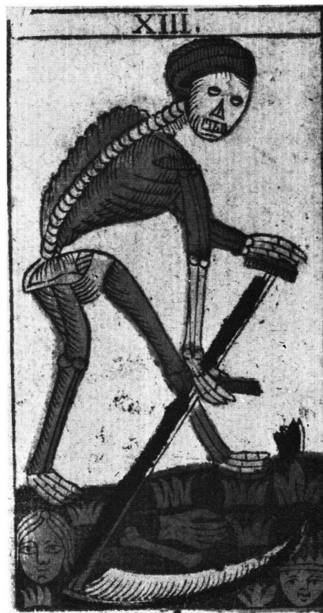
Abb. 4 Trumpf Nummer XIII «Der Tod», in den Abrechnungen meist «Figure de la mort» genannt, war «Stempelkarte» für die Tarockspiele. Format 116 × 63 mm. Herkunft und Aufbewahrungsort wie Abbildung 3

In Anbetracht dieser Umstände kam das Schatzamt den Kartenmachern immerhin ein Stück weit entgegen, jedoch nicht ohne sich gehörig – nach oben und nach unten – abgesichert zu haben 39 :