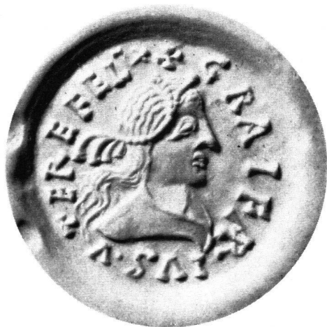
Abb. 2 Abdruck des Siegelrings (Abb. 1), Vergrößerung

Zur Frage der Datierung können wir auf Grund unseres