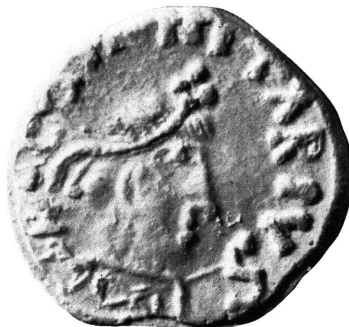
Abb. 3 Vergrößerung aus Abb. 4

ein Kreuz stellen ließ, wie es sowohl auf unserem Ring wie auf den Münzen zu erkennen ist 14 . Da Profilbüsten mit dem Kreuzdiadem auf byzantinischen Münzen sehr selten sind und bezeichnenderweise nur im westlichen Teil des Reiches, im Exarchat Ravenna, vorkommen 15 , wäre es nicht undenkbar, daß als Vorlage für unsere merowingischen Gepräge wie den Ring die häufigere Frontalbüste der byzantinischen Gold- wie Bronze-münzen gedient hat 16 . Die zu beiden Seiten herabhängenden Pendilien wären in diesem Fall mißverstanden und hinten im Nacken einfach aneinandergereiht worden.