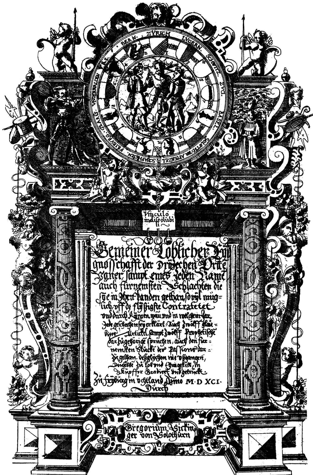
Gregorius Sickingher, 1591. Titelblatt zur radierten Folge der Bannerträger