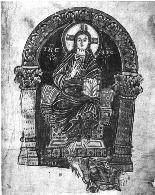
Abb. 1 Cod. Eins. 156 (Msc. 239), vorgebundenen Blatt, recto: Majestas Domini und Ezechiel

Beischriften kennzeichnen die Figuren: «JHC» und «XPC» den thronenden Christus, und «EZECHIEL PPH» den Propheten.