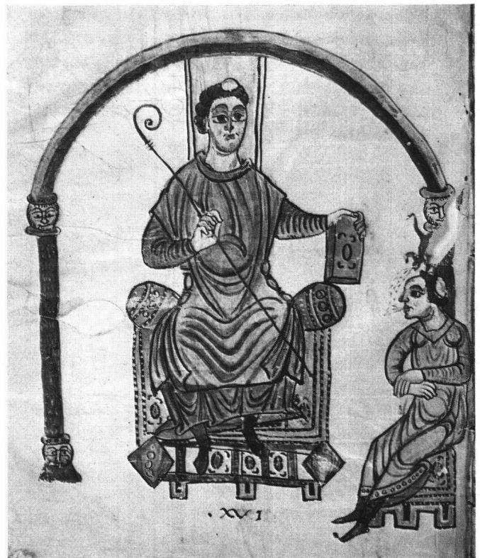
Abb. 5 Cod. Eins. 135 (Msc. 539), p. 248: Hieronymus und Helvidius

Fassen wir die gemeinsamen Merkmale dieser Miniaturen nochmals kurz zusammen. Dreimal sind wir dem Prinzip zweier unter einer Doppelarkade thronenden Figuren begegnet, zweimal sitzt eine einzelne Figur unter einer einfachen Bogenstellung. An den Säulen wird versucht, Marmor oder Porphyrt wiederzugeben; das Blattwerk an Kapitellen und an Bogen ist weich gelappt und mit weißen Lichtern gehöhlt. Alle Figuren sitzen auf kastenförmigen, mit einem Unterbau in Verbindung stehenden Thronen. Perlbänder oder Filigran unterteilen die Schaufflächen der Sitze in Felder, welche mit großen, roten Schmucksteinen besetzt sind. Sitzfläche und Standfläche der Schemel weisen den Kanten parallel laufende, andersfarbige Leisten auf. Grüne Untermalungen und rote Schatten erzeugen bei den Gesichtern der Figuren einen geradezu maskenhaften Effekt, der auf eine extreme Umsetzung byzantinischer Gesichtsmodellierung zurückgeht. Verglichen mit den meist übermäßig groß gezeichneten Händen erscheinen die Füße recht klein. Für die Gewanddarstellung bedeuten die Zeichnung der Faltenstege, bestehend aus weißen, von kurzen Schraffen begleiteten Linien, und die häufig auftretenden fein gewellten Konturen eine Besonderheit. Die Gewandstoffe erhalten verschiedentlich eine Musterung von andersfarbigen Punktgruppen. Gewandborten wie Architekturteile werden oftmals mit Reihen von kleinen Kreisringen verziert. Bei Gregor, Petrus Diaconus und Isidorus nehmen die Aufschläge der weiten Ärmel Dreieckform an.