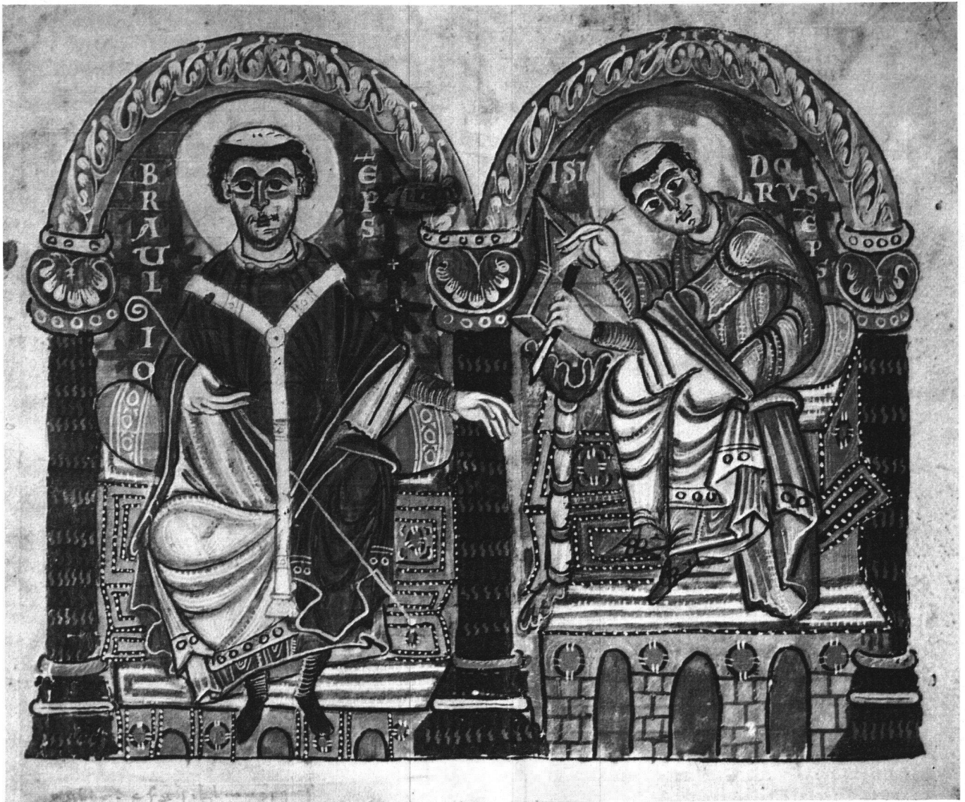
Abb. 3 Cod. Eins. 167 (Msc. 140), p. 1: Bischof Braulio und Isidorus

ansicht versucht: die Standfläche des Unterbaus und die rechte Seite des Thrones schieben sich vor die Säule, um nicht von dieser überschritten zu werden.