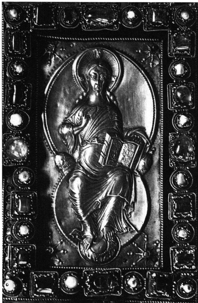
Abb. 6 Codex Aureus von St. Emmeram in Regensburg (München, Staatsbibl., Clm 14000): Prachteinband, Detail mit thronendem Christus

Mit seinem Hinweis auf die Hofschule Karls des Kahlen hat uns De Wald aber den Weg zu einem besseren Vergleichsbeispiel angedeutet. Eine Majestas Domini mit von außen gezeigter Rechten 17 finden wir auch auf dem Deckel des Codex Aureus von St. Emmeram in Regensburg (München, Bayerische Staatsbibl., Clm. 14000) (Abb. 6).