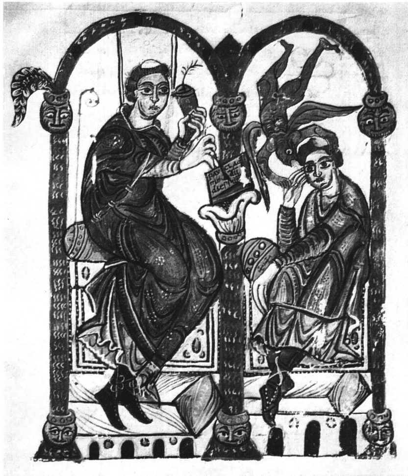
Abb. 4 Cod. Eins. 135 (Msc. 539), p. 2: Hieronymus und Jovinian

einem grünen Grund hinterlegt. Auf p. 2 erscheint eine reichere Zierinitiale, «Ut valeas» (120: 91 mm), vor einem Purpurgrund, der, wie bei der Miniatur auf p. 1, ein Sternmuster aufweist 12 .