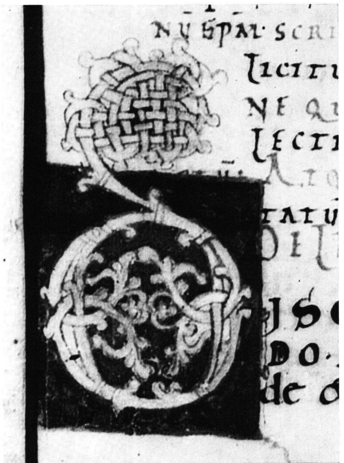
Abb. 9 Cod.Eins.167 (Msc.140), p.7, Initiale «d» (isciplina), 47:47 mm, HG: Purpur / Initiale: rote Kontur, gelb gefüllt, Grund: grün

und Trier sollen im folgenden auch historisch belegt werden, um als glaubwürdige Resultate dazustehen.