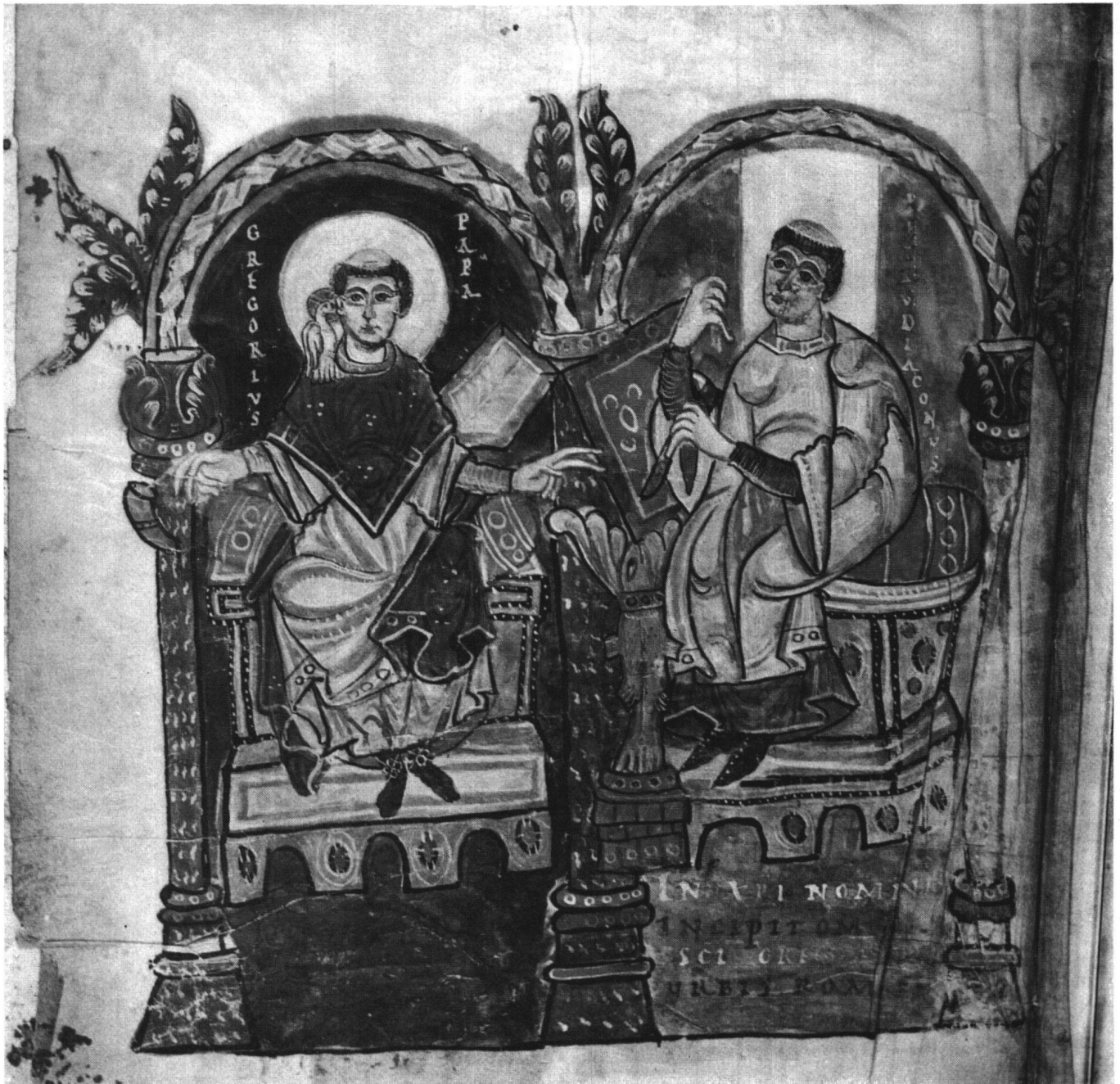
Abb. 2 Cod. Eins. 156 (Msc. 239), vorgebundenes Blatt, verso: Gregorius und Petrus Diaconus

Der Arkadenbogen, der das Bildfeld der Majestasdarstellung nach oben begrenzt, ist mit einem Palmettenornament verziert und wird von zwei Säulen getragen. Der rostrote Rundbogen, dessen Blätter mit Lichtern weiß gehöhlt sind, ruht auf einem ockergelben Torus. Das grüne Akanthuslaub der Kapitelle setzt in zwei Kränzen an und sprießt stark vegetabil. Die weißen Lichter wurden hier in feinen Schraffen aufgetragen. Die Säulen imitieren Marmor oder Porphyrt, indem auf grünlich-grauen Grund Reihen von roten und gelben Farbtupfen gesetzt