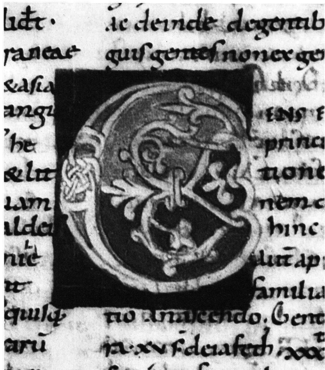
Abb. 8 Cod.Eins.167 (Msc.140), p.195, Initiale «G» (ens est), 46:56 mm, HG: Purpur / Initiale; gelb, Grund: grün

Die stilistischen Untersuchungen ließen zwei wichtige Handschriften als von Einsiedler Künstlern möglicherweise benutzte Vorlagen hervortreten, den Codex Aureus Karls des Kahlen, der zur Zeit der Entstehung der besprochenen Einsiedler Handschriften in St.Emmeram in Regensburg lag, sowie den für den Trierer Erzbischof Egbert geschaffenen Psalter. Der Herkunftsort des Egbert-Psalters ist gegenwärtig heftig umstritten, ein Problem, das hier jedoch lediglich angedeutet werden kann: galt die Handschrift nämlich bis jetzt als Erzeugnis der Reichenauer Buchmalerei, so wird von jüngsten Untersuchungen als Entstehungsort Trier vorgeschlagen 40 . Für unsere Problemstellung bleibt die Frage nach der Herkunft des Egbert-Psalters jedoch von sekundärer Bedeutung, da in erster Linie die Tatsache, daß er in Trier aufbewahrt wurde, maßgebend ist. Die sich somit ergebenden Verbindungen von Einsiedeln zu Regensburg