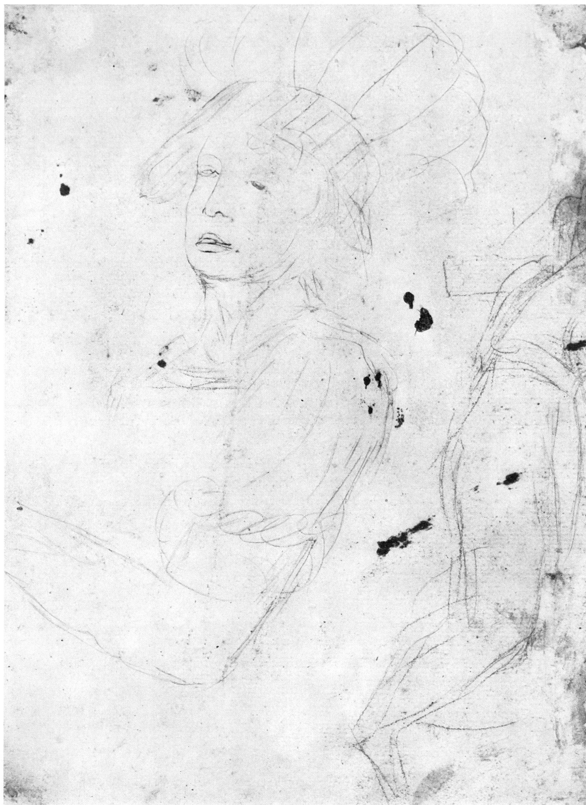
Heinrich Füssli, Femme inconnue, esquisse au crayon. Verso du dessin de la planche 36 (248 × 177 mm). Musée national suisse