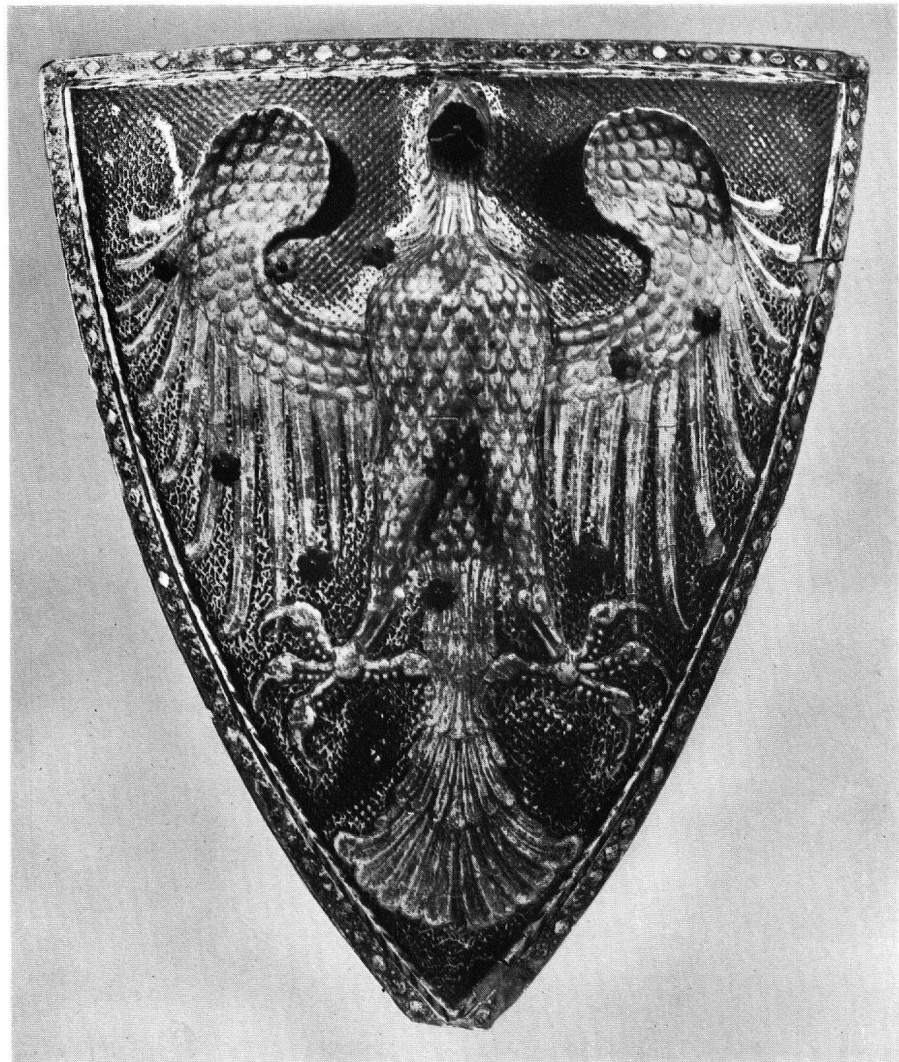
REITERSCHILD MIT DEM WAPPEN VON RARON