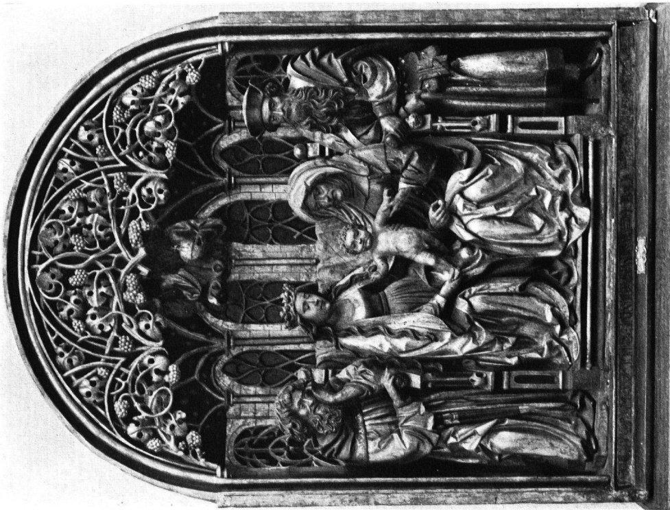
Marienkronung vom ehemaligen Hochaltar der Stiftskirche von Einsiedeln Aus Pfäffikon (Schwyz). Zürich, Schweiz. Landesmuseum (Nachrichten, S. 124)