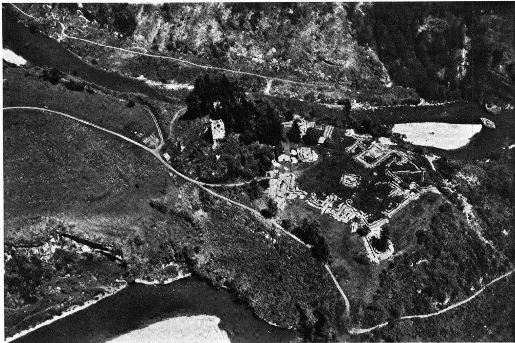
Der Schloßhügel zu Beginn der Ausgrabungen nach dem Fällen der Bäume