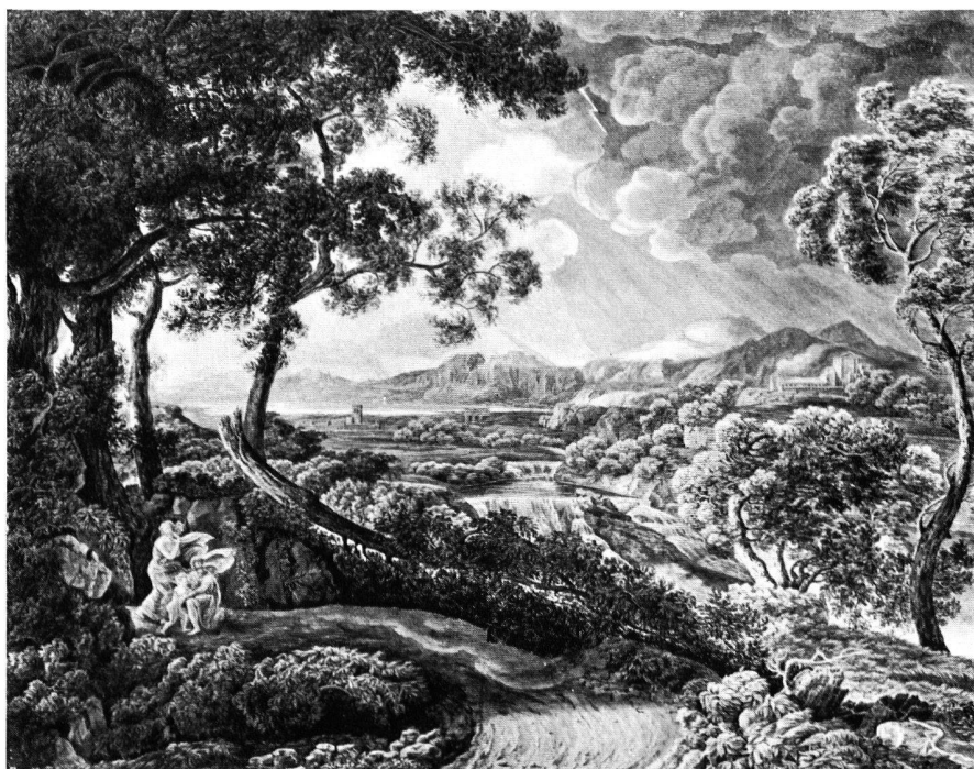
Fig. 3. Kupferstich von G.F.Gmelin nach dem Gemälde von Gaspard Dughet «Il temporale»