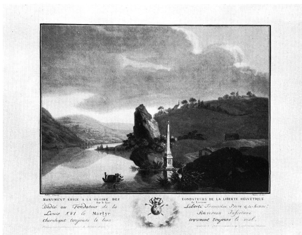
Abb. 2. Aquatintablatt von Descourtis nach Caspar Wolf (1735–1798)

DAS FREIHEITSDENKMAL DES ABBÉ GUILLAUME-THOMAS RAYNAL auf der Altstaadinsel bei Meggen