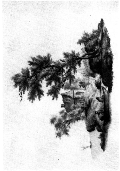
Abb. 6. Heinrich Thomann, Malerei auf einem Zürcher Porzellanteller, um 1775.