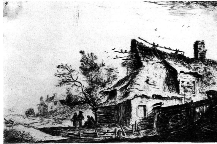
Abb. 3. Radierung von Anthonie Waterloo (1610?—1690) Die Mühle am Wasser