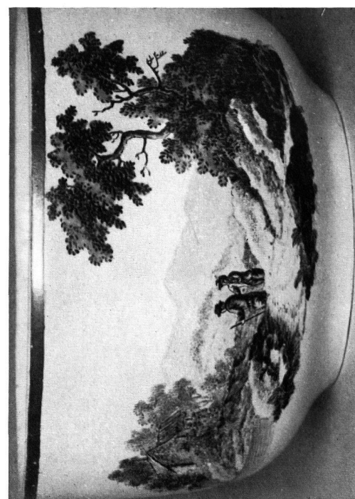
Abb. 8. Malerei auf einer Zuckerdose aus Zürcher Porzellan