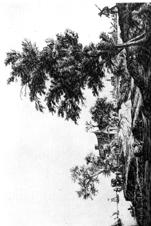
Abb. 5. Anthonie Waterloo (1610?—1690). Die Hütte auf dem Hügel, um 1650