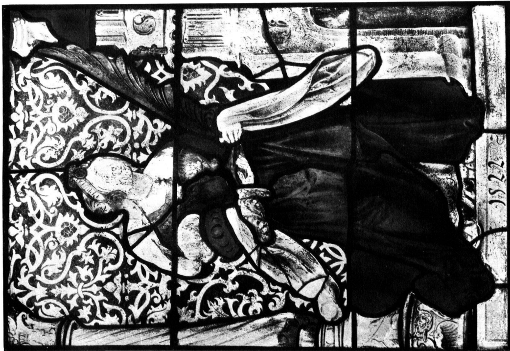
Fig. 2. NICOLAS MANUEL. LA CRUCIFIXION, 1518 Photographie prise après la transposition, après l'enlèvement des repeints et après la restauration de petits accidents (Décembre 1937)