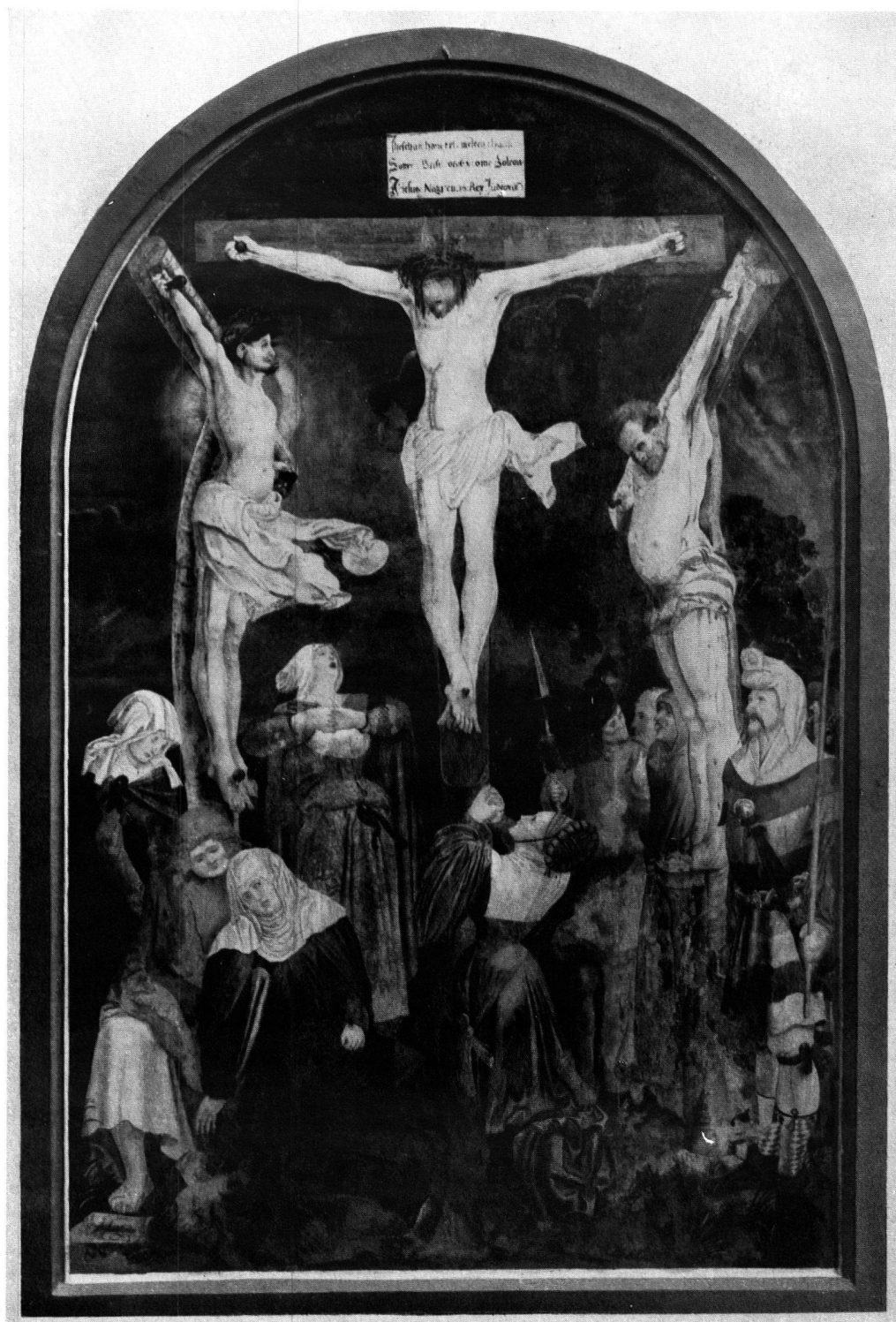
Fig. 4. NICOLAS MANUEL. LA CRUCIFIXION, 1518 Usson (Puy-de-Dôme)