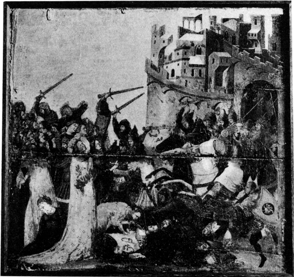
Abb. 1. Tafelbild mit Szene aus der Ursulalegende, aus Rovio, um 1440 Zürich. Schweiz. Landesmuseum

Diese Szene stimmt nun bis in die Einzelheiten genau mit dem linken Flügel eines Triptychons überein, das sich heute (als Leihgabe der Uffizien) in der Pinakothek zu Arezzo befindet. Der ganze Altar — die Arbeit eines toskanischen Provinzmalers vom Beginn des 15. Jahrhunderts — stellt in der Mitte die Kreuzigung, links die Ankunft der hl. Ursula in Basel und rechts eben unsere Szene, das Mar-