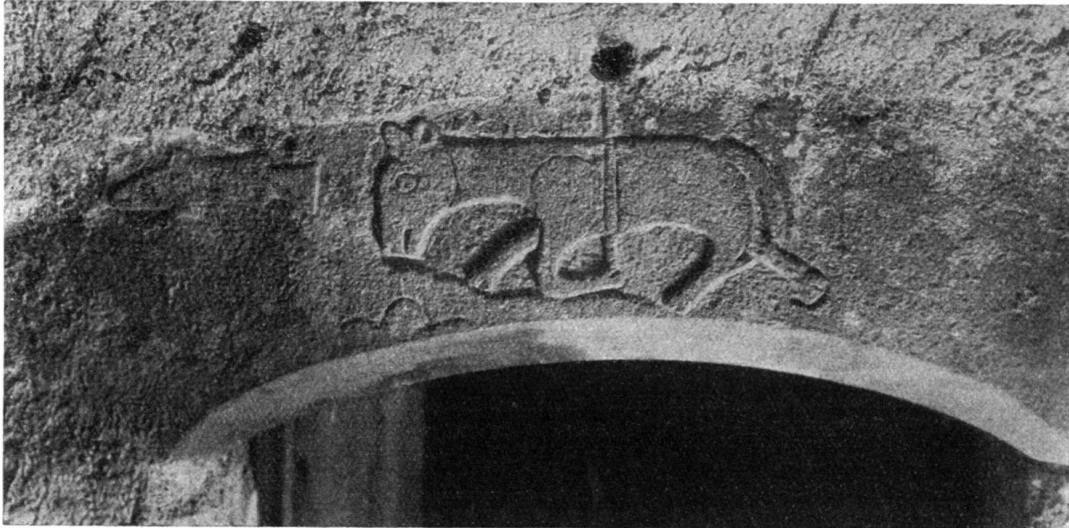
S. Lucius. Türsturz mit Relief.

neu errichtete Gotteshaus beziehen 1) . Indessen scheinen damals die Arbeiten am Neubau keineswegs abgeschlossen gewesen zu sein. Denn eine in Kopie noch erhaltene Konsekrationsurkunde sagt uns, daß am 15. Oktober 1295 eine Gesamtweihe der Kirche stattgefunden hat, und nach allem, was wir bei der Baugeschichte des Domes gehört, wird dieses späte Datum uns nicht mehr überraschen. Daraus, daß in der Konsekrationsurkunde wohl von der Weihe des Marienaltars, nicht aber von jener des Hauptaltars gesprochen wird 2) , darf man schließen, daß der Bau nach der Vollendung des Presbyteriums stecken blieb und die Errichtung des Langhauses erst später zustande kam 3) .