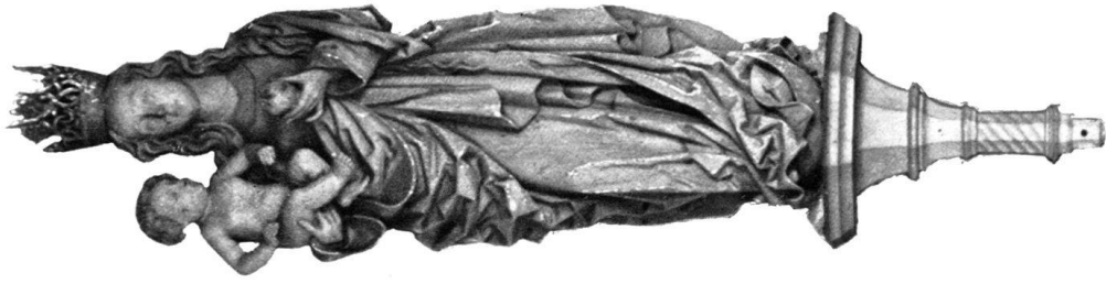
c) MADONNA, Holz. Beinhaus St. Michael, Zug.