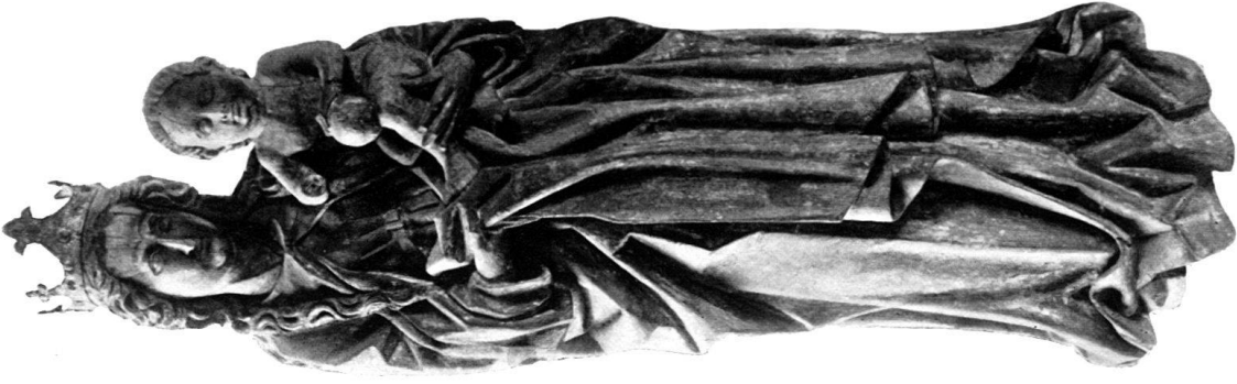
b) MADONNA, Holz, aus Hinter- hünenberg. Landesmuseum.