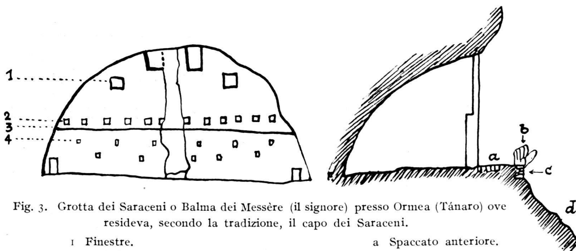
Fig. 3. Grotta dei Saraceni o Balma dei Messère (il signore) presso Ormea (Tánaro) ove risiedeva, secondo la tradizione, il capo dei Saraceni.