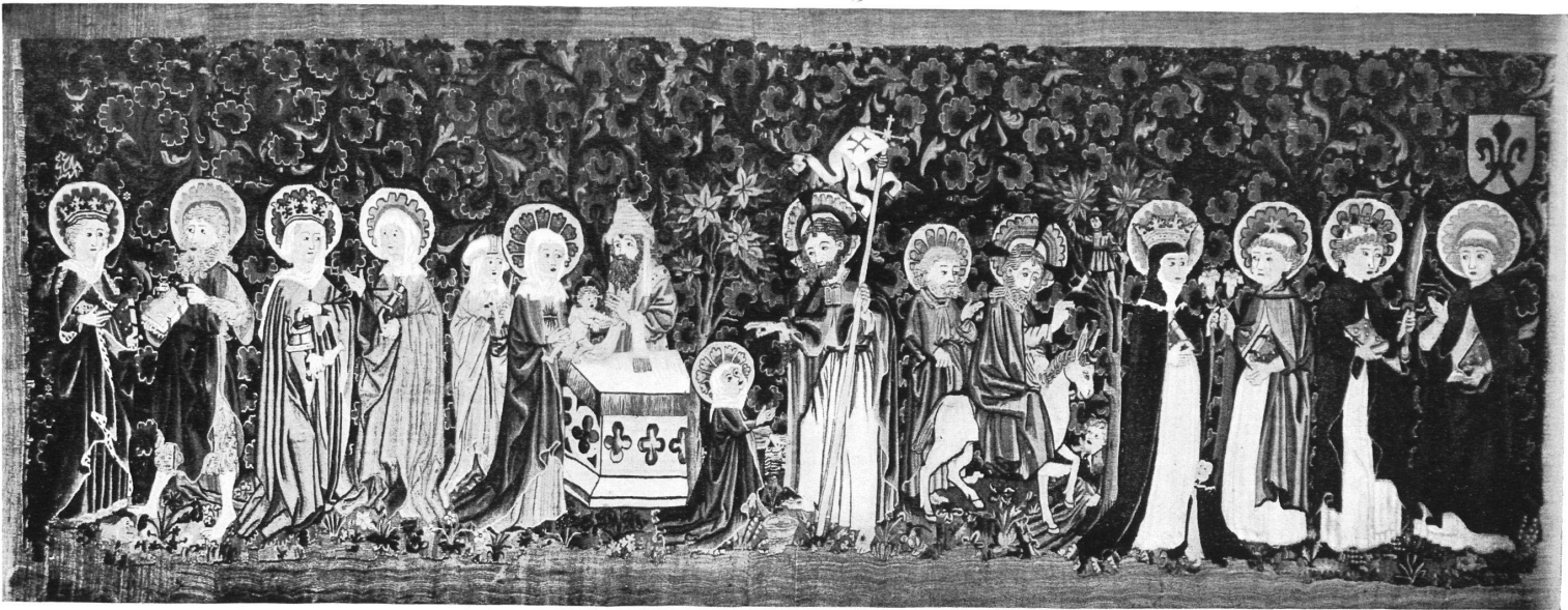
Schönkind-Teppich. Höhe 1,05 m, Breite 3 m. Basel, 15. Jahrh. Im Historischen Museum zu Basel. Ankauf 1920.