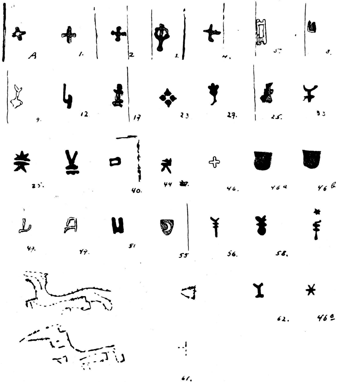
Abb. 1. A. Marke des Messerdolches. Heft 1, Taf. IV, Nr. 1. (Die übrigen Marken sind mit den Nummern der entsprechenden Dolche und Degen der Tabelle Heft 2, S. 117/118 bezeichnet.)

Nach Boeheim wäre sie als Beschauzeichen der Mailänder Klingenschmiede aufzufassen 1) . Es ist sicher, daß Klingen im Mittelalter von Italien nach der alten Eidgenossenschaft eingeführt wurden, doch daß dies gerade bei diesen typi-