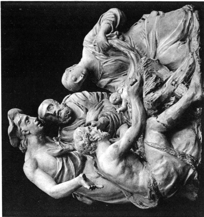
Ildephons Kuriger: Weihnachtsgruppe. Sammlung des Stiftes Einsiedeln