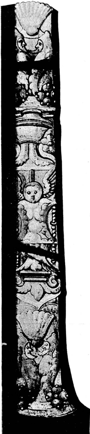
Abb. 3. Seitenstück einer Bildscheibe in Wettingen.

Die Putten, welche auf der einem Kandelaber ähnlichen Umrahmung zur Verwendung kamen, entsprechen ebenfalls in ihrer Zeichnung wieder denjenigen