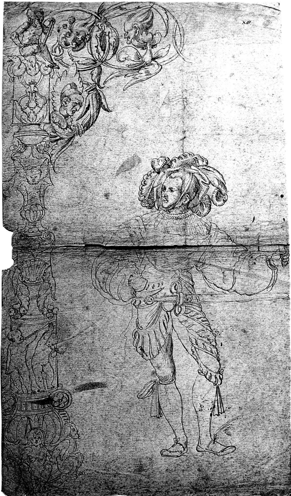
Niklaus Manuel Deutsch Scheibenriss im Hist. Museum in St. Gallen.