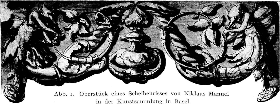
Abb. 1. Oberstück eines Scheibenrisses von Niklaus Manuel in der Kunstsammlung in Basel.