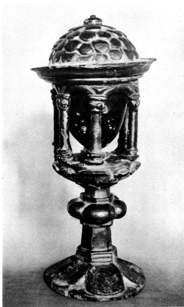
Abb. 1. Holzciborium aus der Kirche von Prugiasco, 16. Jh. I. H.

In Prugiasco liegt auf steiler Höhe über dem Dorf eine kleine, ins 12. Jahrhundert zurückgehende Kirche, ursprünglich dem hl. Ambrosius (gest. 397), dem Patron der Mailänder Diözese geweiht, später auch Negrentino, und seit ungefähr 1600 seinem