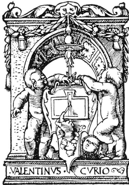
Abb. 5. Hans Holbein d. J. Signet des Val. Curio. Holzschnitt vom Winter 1521/22.