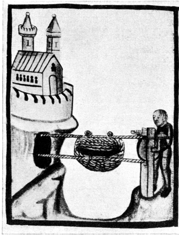
Abb. 1. Seilschwebebahn, 1411.

Geschütze nebst weiterer Mannschaft. Am 17. August traf die ganze Streitmacht von Basel mit Zuzügen von Solothurn und Bern in der Stärke von ungefähr 5000 Mann vor Rheinfelden ein, wozu dann noch am 21. d. M. die Hauptbanner von Bern und Solothurn mit weiteren 3000 Mann und drei Hauptbüchsen und sonstiger Artillerie kamen. Im ganzen lagerten gegen 8000 Mann mit fünf großen Büchsen, 300 Handbüchsen und Feldgeschützen in zwei Lagern, das eine östlich der Stadt beim St. Johanneshaus, das andere westlich längs der Straße nach Basel, in der sogenannten Klos. Hier auf dem Areal der früheren Zündholzfabrik, wo sich heute die Kurbrunnenanlage befindet, waren die Hauptbüchsen in einer Entfernung von 160 m von der Burg