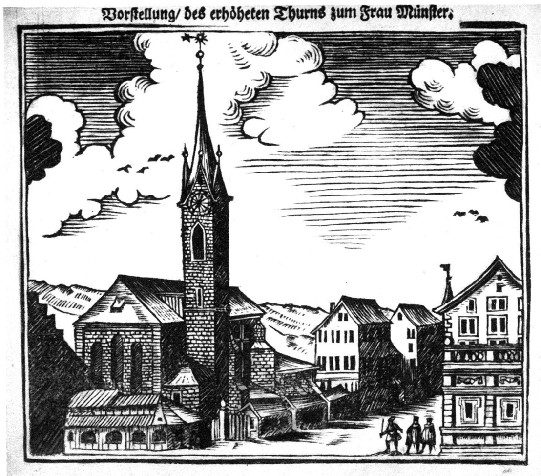
Abb. 2. Ansicht des Fraumünsters in Zürich. Holzschnitt nach 1732.