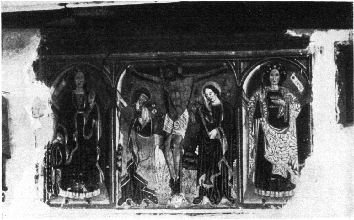
Abb. 5. Curaglia. Kreuzigung, St. Katharina (l.) und St. Lucia (r.). Arbeit von Antonius de Tredate, 1510.

Das Christophorusbild am Turm der alten St. Martinskirche in BRIGELS wurde im Sommer 1930 einer Erneuerung unterzogen. Nachdem eine Untersuchung ergeben hatte, daß die Figur so verwittert war, daß eine Restauration unmöglich erschien, entschloß man sich für eine ganz neue Figur im spätgotischen Charakter, aber modernisiert; als Vorbild diente der Christophorus von Platta. St. Martin besitzt eine Holzdecke mit prächtigen spätgotischen Holzschnitzereien und einem Flügelaltar von 1518 1) .