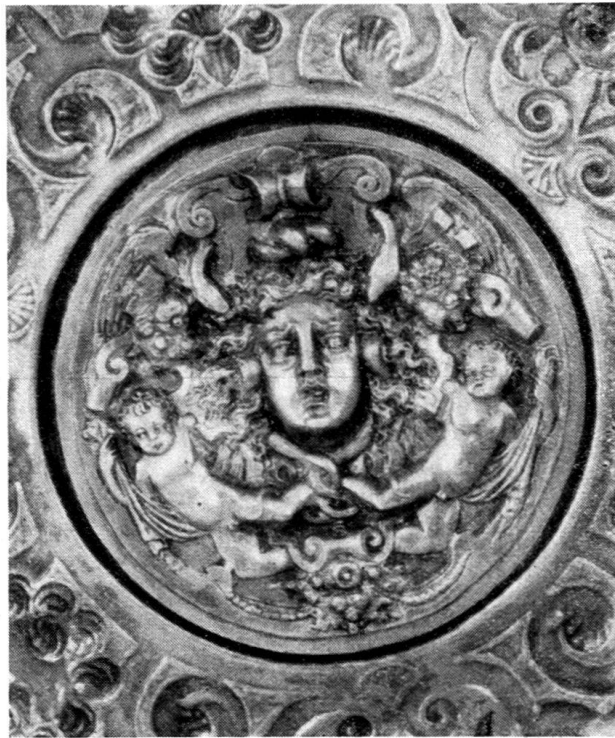
Abb. 1. Zierplakette im Deckelinnern des Pokals mit Wappen des Grafen von Rechberg. Im Besitze der Ortsbürgergemeinde Mels.

Die beiden silbervergoldeten Deckelpokale, welche das Nürnberger Beschauzeichen tragen, sind stilistisch so nahe verwandt, daß man sie demselben Meister zuzuschreiben geneigt wäre, wenn sie nicht durch die Meistermarken sich als Werke zweier verschiedener Goldschmiede ausweisen würden. Zeitlich werden sie ziemlich gleich, zwischen 1580 bis 1590, zu datieren sein. Nahe steht ihnen in den Ornamenten der im Jahre 1584 vom Stande Genf den Bernern gestiftete