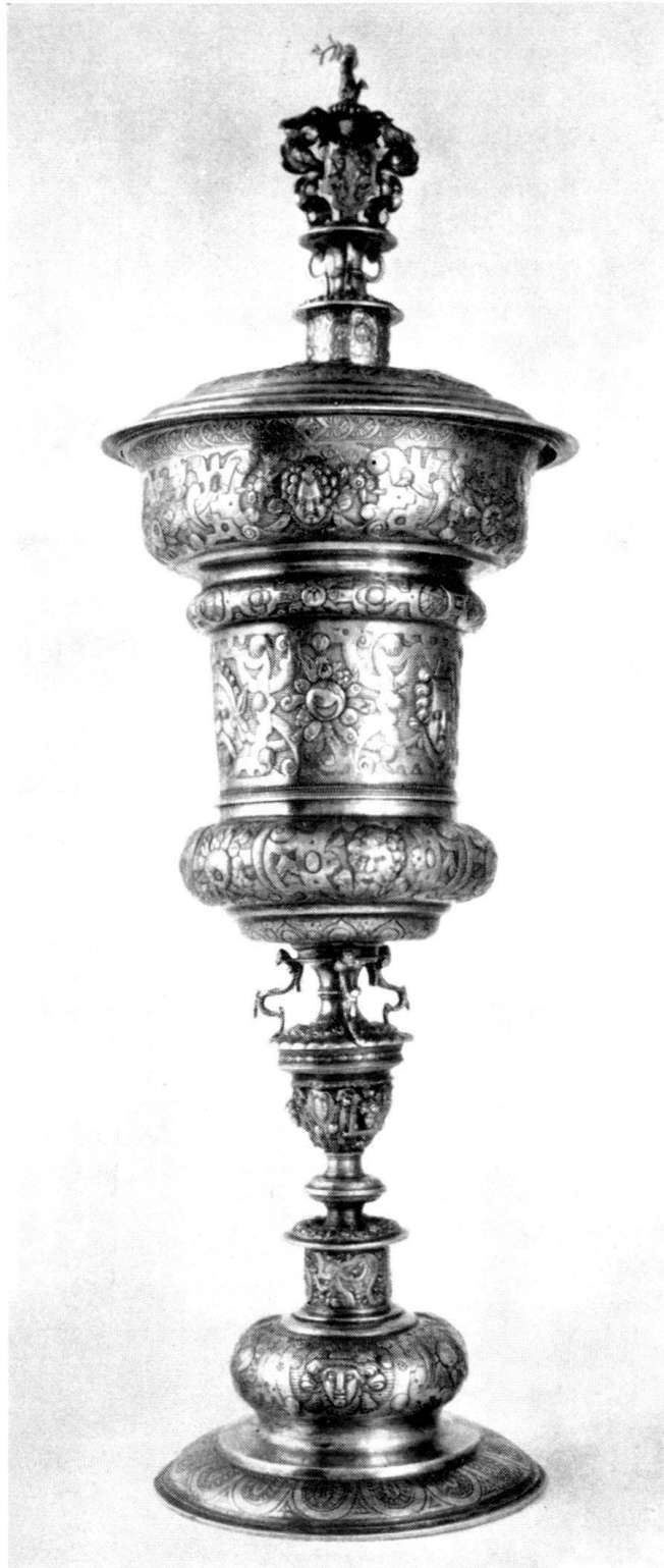
Deckelpokal mit Wappen der Grafen von Rechberg und Meistermarke des Nürnberger Goldschmiedes Peter Schleich.