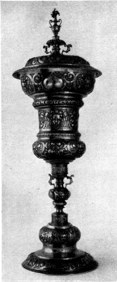
Abb. 2. Deckelpokal im Besitz der Ortsbürger- gemeinde Mels und Meistermarke des Nürnberger Goldschmiedes Nikolaus Emmerling. H. 49 cm.