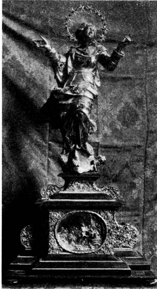
Fig. 2. Das Bruderschaftsbild vor der Renovation.

Am 26. April 1693 wird gemeldet, daß in das neue Kästchen verschlossen worden seien: 30 neue Kronen und 17 Batzen an Geld, die an das silberne Marienbild verehrt wurden; außerdem ein silberner Gürtel und ein goldener Ring mit einem Saphir. Hauptmann Urs Sury vergabte daran altes Silbergeld im Werte von