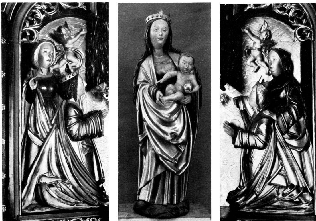
Abb. 2. Vigen, Pfarrkirche. Hochaltar, Schreinfiguren (ehem. Aufstellung).