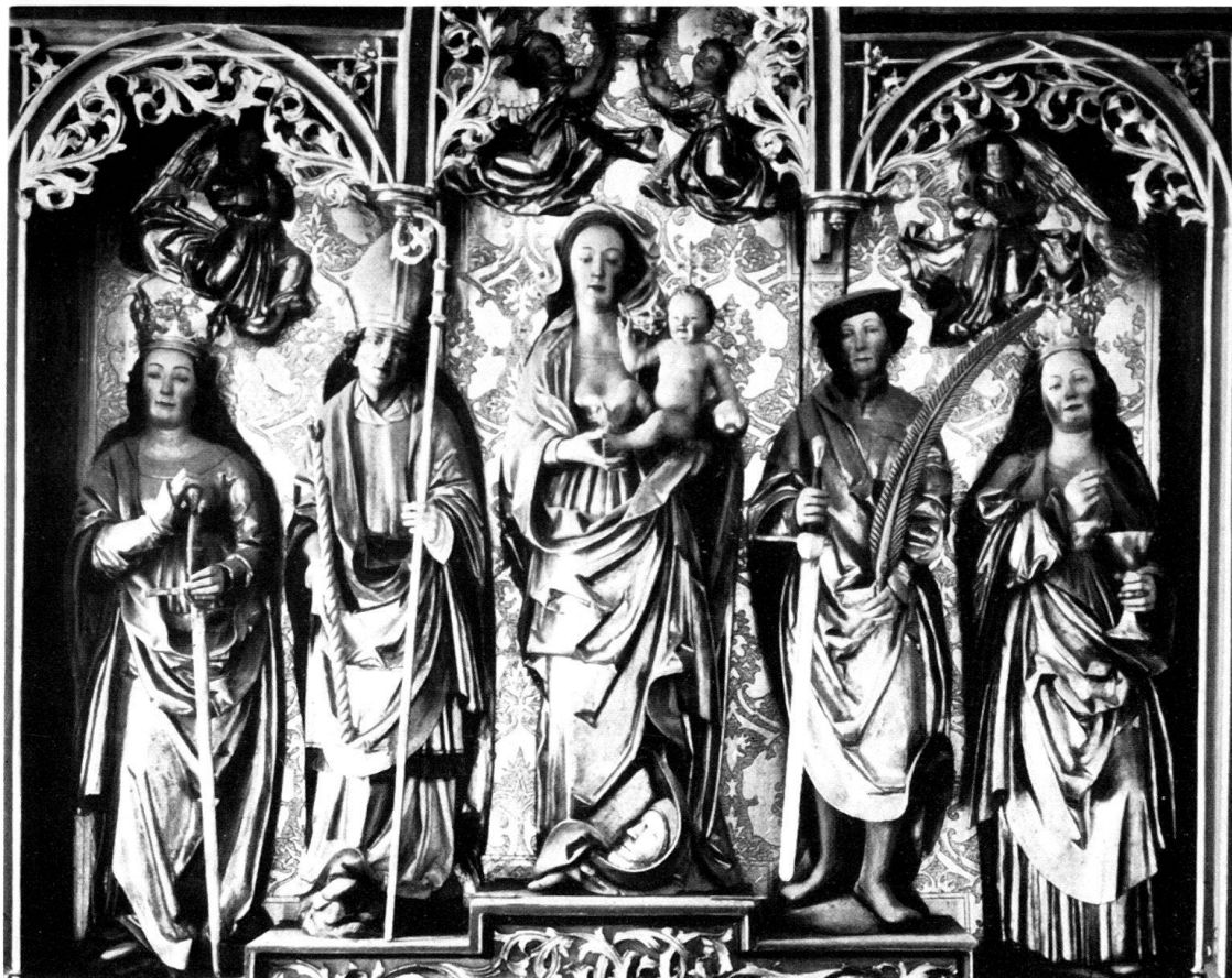
Abb. 1. Tinzen, Pfarrkirche, Hochaltar, Schrein.