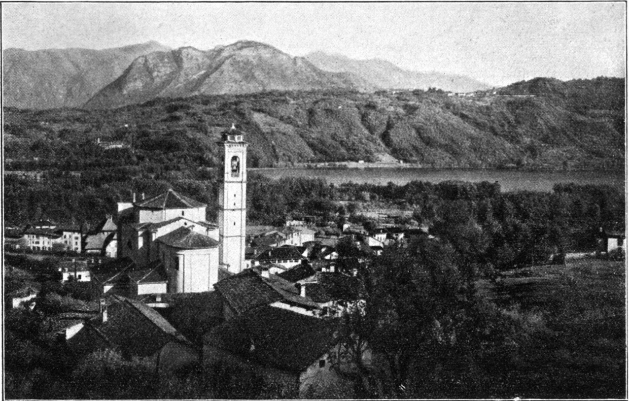
Clich. Verlagsanstalt Benziger & Cie. Einsiedeln.