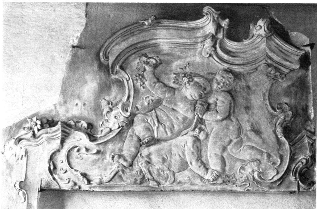
Fig. 7—8. Stucchi di Giovanni Rodolfo Furlani da Montagnola (vedi pag. 265). AGNO. Casa prepositurale.