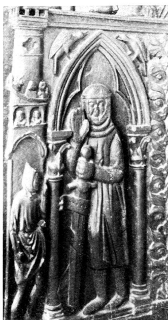
Fig. 3. David et Goliath.