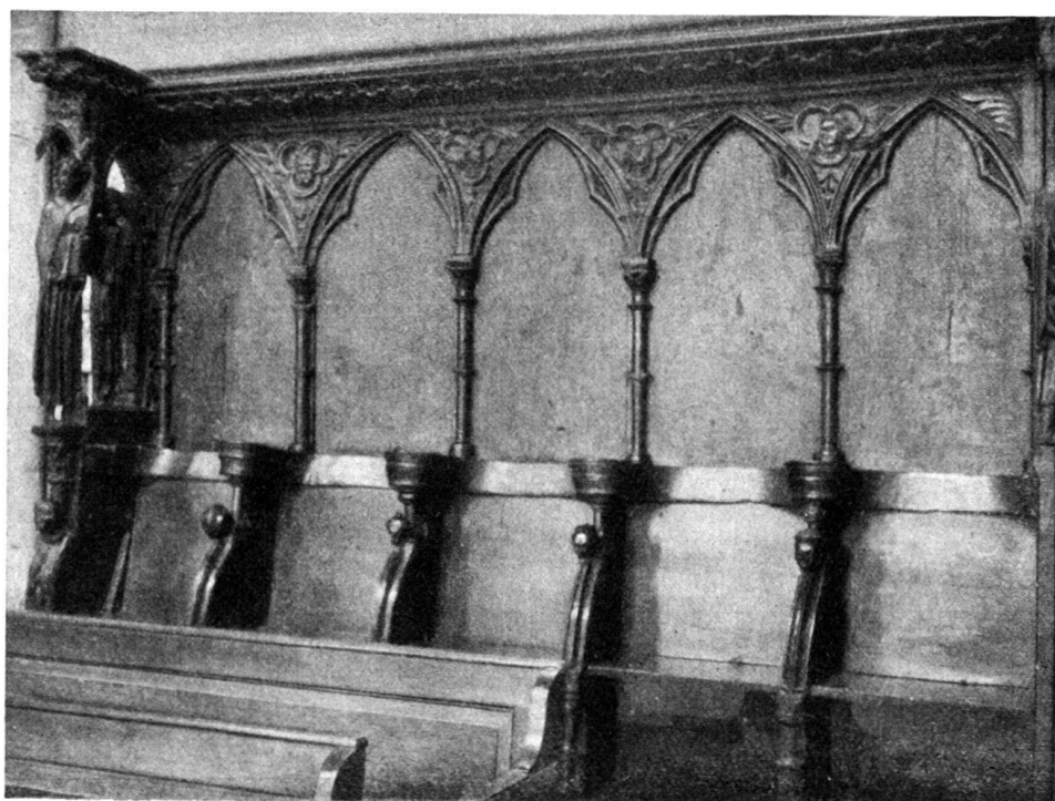
Fig. 1. Cathédrale de Lausanne. Stalles du XIII e siècle. Un groupe de stalles (ensemble)

rosaces analogues à celles de l'entablement extérieur de la Cathédrale. Aux dorsaux se développe une arcature formée d'une suite d'arcs brisés qui reposent sur les chapiteaux de colonnettes au fût interrompu par une bague, comme celui des colonnes du Portail peint ou Porche des Apôtres. Les trèfles qui occupent les écoinçons de ces arcatures (ce motif se retrouve dans plusieurs parties de l'église, notamment à l'arcature des bas-côtés, à certains médaillons de la rose, aux gâbles du porche méridional) sont en général garnis de têtes humaines ou d'ornements végétaux; on y voit un individu coiffé du même bonnet sacerdotal que celui de plusieurs personnages du Portail peint, un homme encapuchonné, une femme, deux visages masculins et enfin une rose. (Voir fig. 1.)