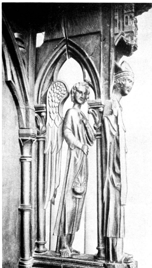
Fig. 1. Evêque et ange thuriféraire.