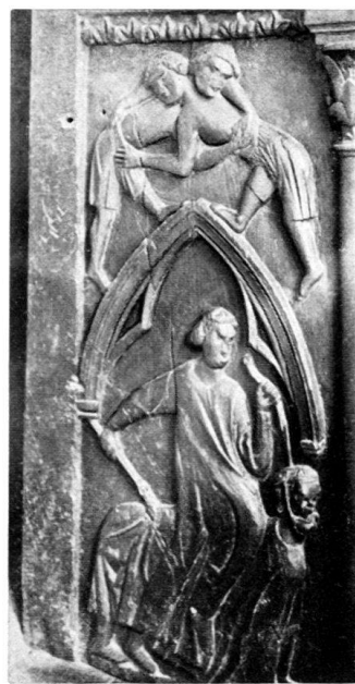
Fig. 4. Lutteurs. Lai d'Aristote.

Cathédrale de Lausanne. Stalles du XIII e siècle: jouées.