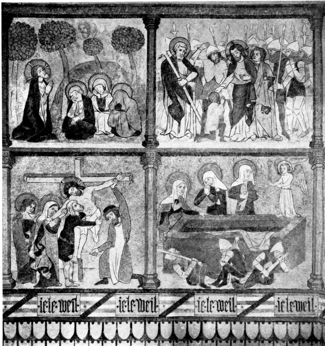
Photographie de Jongh, Lausanne

Fresques de l'église de Ressudens. Série méridionale I.