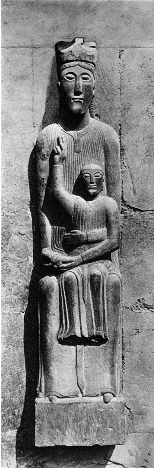
1. Maria an der Johanneskirche in Schwäbisch Gmünd Sandstein