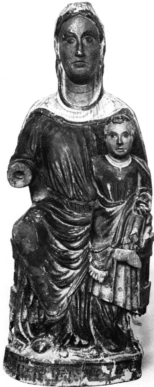
Maria aus Naters Holz