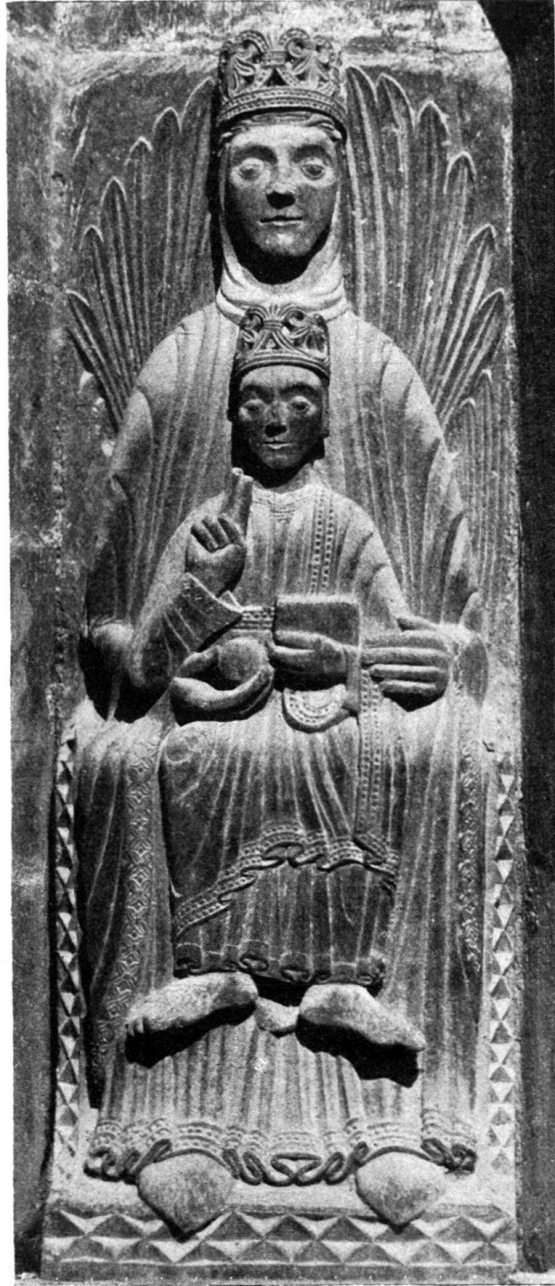
Abb. 3. Maria über dem Südportal der Kirche von Sainte-Ursanne. Sandstein.

geordnet, hielten das Kind, das, wie ein Dübelloch verrät, inmitten des Schoßes saß. Die Linke zieht zugleich den goldenen Mantel in einer Diagonalen über den Unterkörper. Der Stil der Figur weist auf die erste Hälfte des 13. Jahrhunderts.