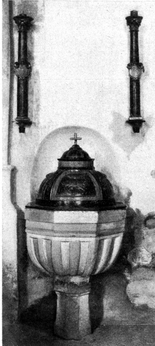
Abb. 1. Die beiden Zunftkerzenhalter in der alten Kirche von Balsthal.

Wohl die meisten, wenn nicht alle Berufsorganisationen des Mittelalters gingen auf kirchlichen Ursprung zurück. So entstanden viele Zünfte aus kirch-