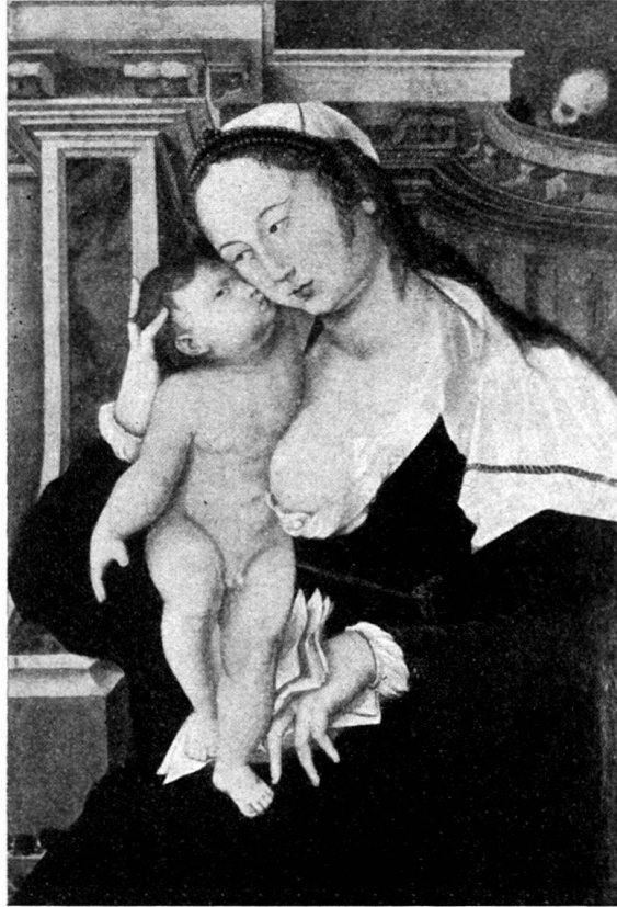
Abb. 5. Hans Baldung: Madonna mit Kind. Gemälde. Nürnberg, Germanisches Museum.

in ihrer ganzen Länge übersichtlich von der Folie des Hintergrundes ab, auch der Fuß dreht sich, fast gewaltsam, in die Bildfläche. Bei der Figur der Omphale endlich zieht der Künstler die letzte Konsequenz aus seinem Streben nach flächenhafter Klärung der Form: das Gesicht ist, ganz wie bei der erwähnten Madonna, in die Bildebene gedreht, während im übrigen der Gestalt eine reine Profilstellung gegeben ist. Für das Motiv der zweifachen Armbewegung möge man übrigens den Marcus Curtius vergleichend heranziehen, wo ein ähnliches