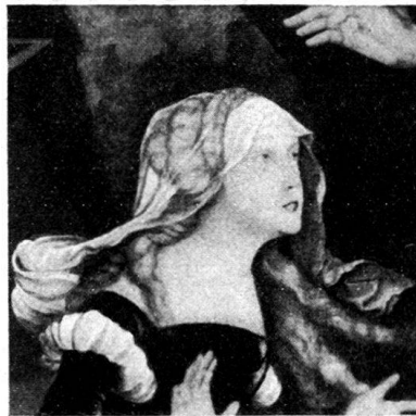
Abb. 6. Hans Baldung: Noli me tangere. Ausschnitt. Darmstadt, Hessisches Museum.