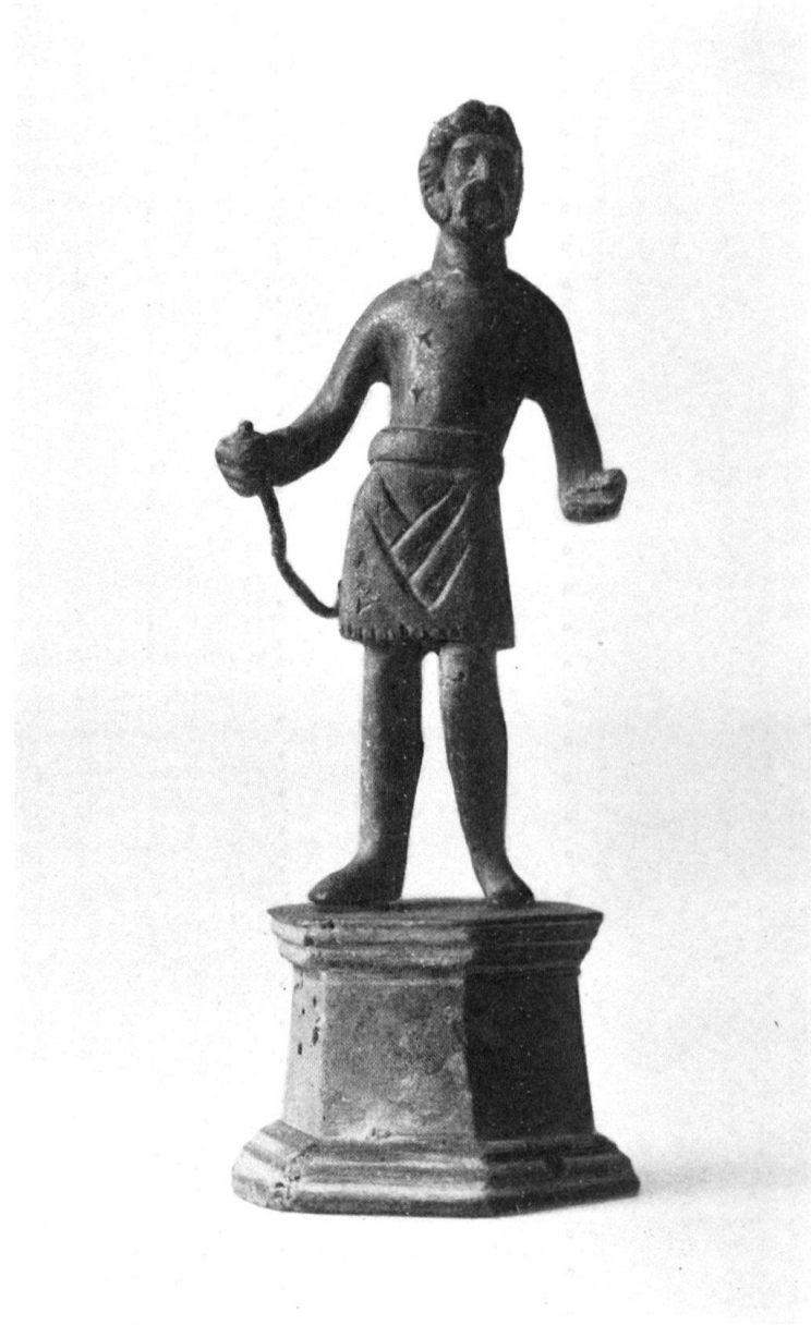
SUCELLUS AUS AUGST. (Zu S. 203.)